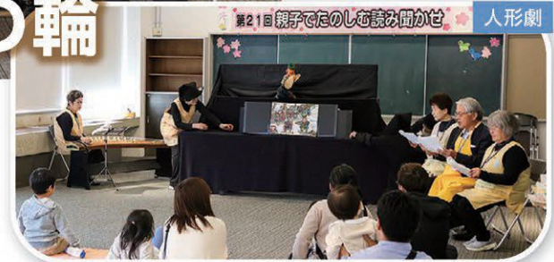
上の写真は4月11日に開催された「第21回親子でたのしむ読み聞かせ」の様子です。エプロンシアター、大型絵本、琴による弾き語り、人形劇など、多様な手法を用いた読み聞かせを披露し、子どもたちを楽しませていました。会ではこのほかにも様々な活動を行っています。