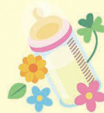
高木 あさひ 朝陽ちゃん (俊希・愛美) 赤羽