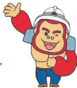
須賀川消防 マスコットキャラクター マモタン

ただいま、消防署では町内全世帯への住宅用火災警報器の設置を目指して、希望する世帯を訪問し、住宅用火災警報器の取り付け支援サービスを無料で実施しています。年中無休で対応いたしますので、ぜひ石川消防署までご相談ください！