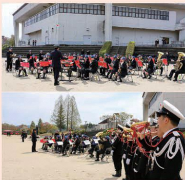
▲一日体験入団の様子

若年世代への理解促進として、令和8年度春季検閲式にて学芸部・吹奏楽部の皆様とラッパ隊が合同で演奏する一日体験入団を実施しました。