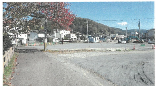
今須橋周辺の作業スペース整備状況

今出川工事便り前号（令和5年9月発行）において、10月下旬から撤去工事を始める予定とお伝えしておりましたが、通行止めの期間をできるだけ短くできるよう施工業者と調整しました。