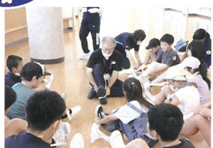
8月 小・中・高校生合同JRCトレーニングセンター（桑折町）