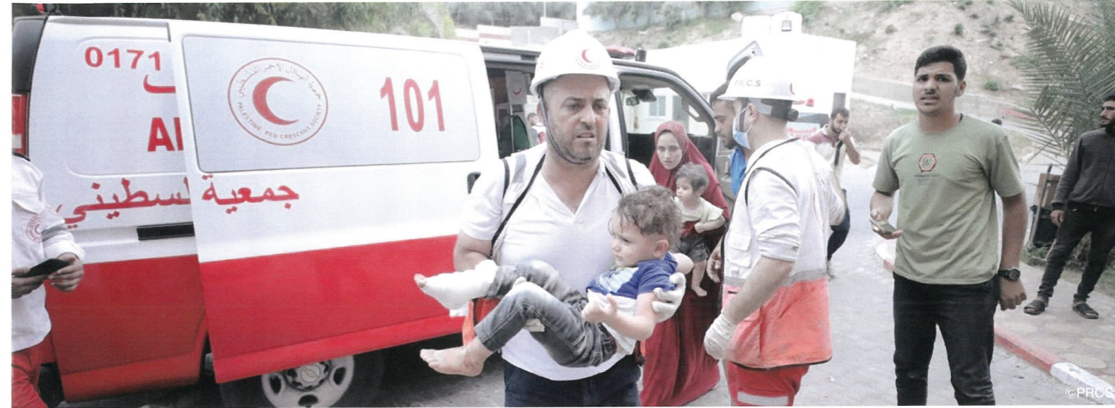
負傷した子どもを搬送するパレスチナ赤新月社のスタッフ