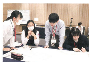
10月 北海道・東北ブロック高校青少年赤十字交流会（福島市）