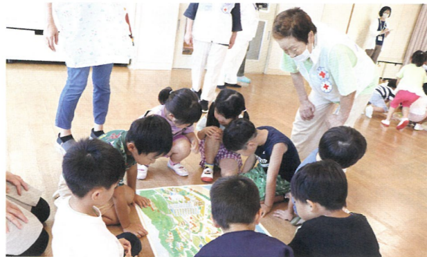
ぼうさいましがいさがし「きけんはっけん!」を保育所で実施