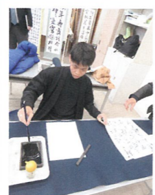
11月 タイJRCメンバーの受入（福島東高校で書道を体験）

赤十字が行う活動は、皆さまが行う活動は、皆さまからお寄せいただいた活動資金とボランティアで支えられています。皆さまのご支援により、災害救護をはじめ赤十字の活動を行えますことにより心より感謝申し上げます。