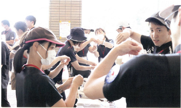
炊飯袋による非常炊き出し（ハイゼックス炊飯）体験

詳しくは事業推進課（TEL 024-545-7996）までお問い合わせください。