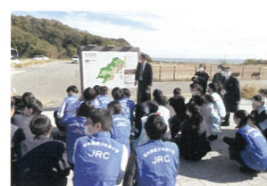
11月 栃木県高校JRCとの合同研修会（いわき市）