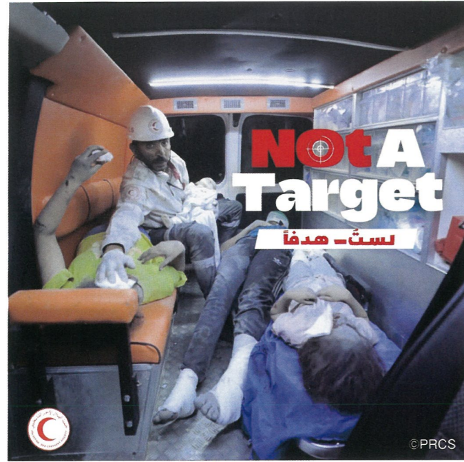
パレスチナ赤十字社では#NotATarget (患者と向きあう病院がターゲットに なってはならない)とのメッセージを発信しています