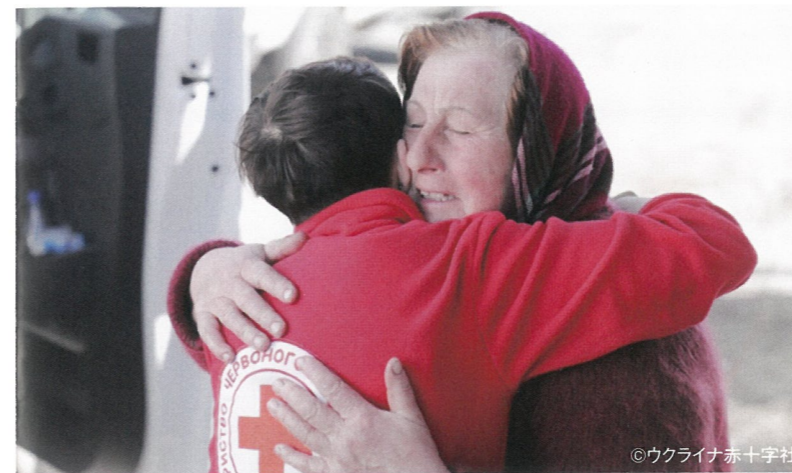
厳しい状況に苦しむ女性を元気づけるウクライナ赤十字のボランティア

赤十字は、人道・公平など赤十字の原則に基づき、中立的な立場から支援を提供します。イスラエル・ガザ人道危機においても、パレスチナ赤新月社とイスラエル・ダビデの赤盾社(イスラエルの赤十字社)、赤十字国際委員会(ICRC)のスタッフやボランティアは最前線で救援活動を続けています。 ※令和5年12月現在