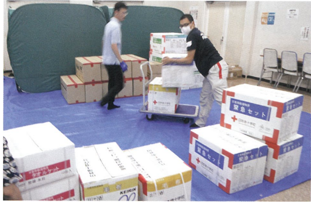
毛布、バスタオル、緊急セット、安眠セット、段ボールベッドを配布

日赤福島県支部では迅速な情報の収集に努め、いわき市へ職員を派遣し救援物資を届けたほか、あん摩マッサージ・はり・きゅう赤十字奉仕団によるマッサージ等を実施しました。