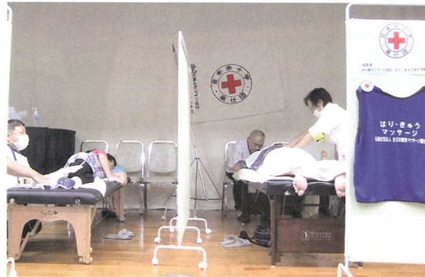
避難所の体育館のステージ上でマッサージを実施