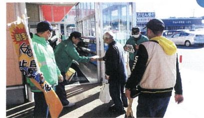
12月17日マルト窪田店での防犯パレードの実施状況

勿来防犯協会は、昭和52年9月に発足し、現在84名の会員で構成され、地域の安全と平穏を守るための各種活動を実施しています。犯罪のない街づくりや少年の健全育成のため、年間を通じた青色回転灯装備車両での巡回パトロールの他、関係機関と連携したなりすまし詐欺被害防止の街頭キャンペーン、さらには、地域住民の防犯意識の高揚のための立て看板の設置等を行い、様々な活動を通して、安全・安心のための地域づくりに積極的に貢献しています。