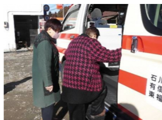
(つながっぺによるミニバスに同乗しての買い物補助活動)

今年度の総会が4月1日に開かれました。この中で、令和6年度の活動として福祉部会の補助サークル「つながっぺ」の助け合い活動、各方部の見守り活動、介護予防のための促進活動の3本立てで活動していくことが決まりました。その中で、「つながっぺ」から始まったミニバスに同乗して買い物補助をする活動は今でも続いています。また、買い物の補助ばかりでなく、ナノカードの使い方や利便性などについて聞かれ、その説明をすることで喜ばれたり、車中では、景色を楽しんでお話ししたりと、買い物以外のところでも、喜んでくれ楽しみに待っていてくれて、お手伝いが出来てよかったです。今後は、引き続き活動を拡げていきたいと思えます。