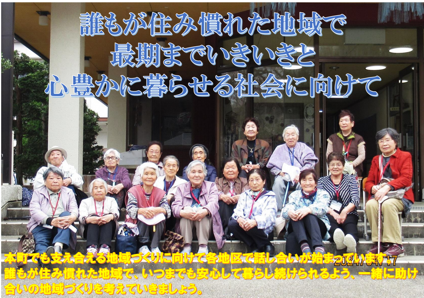
山橋ふれあい広場へ参加の皆さん