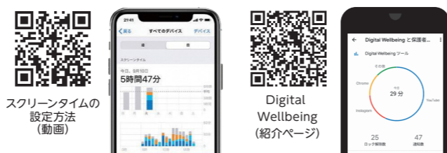
スクリーンタイムの設定方法(動画)

デジタルウェルビーイング Digital Wellbeing (Android10以上)