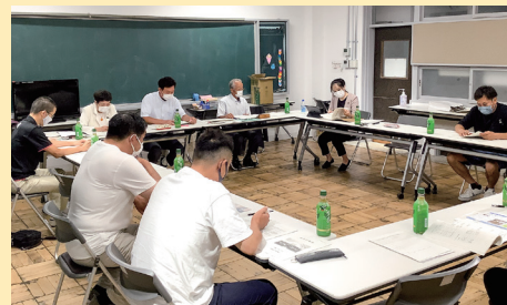
保育所保護者会役員との意見交換会