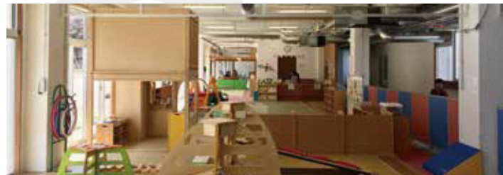
赤ちゃん広場・屋内遊び場

赤ちゃん広場、屋内遊び場は、子ども・子育て支援の拠点です。子育て中のママたちが気軽に集い、交流する場としてもご利用頂けます。また、未就学児を対象とした屋内遊び場は、ボルダリングや、各種遊具が設置され、子ども達が遊びを通して、好奇心や創造力を育てていける空間です。