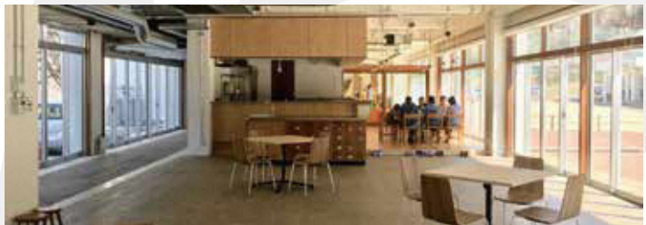
オープンスペース

<開館日・利用時間> 月・木・金 | 午前10時 - 午後6時 土・日・祝 | 午前10時 - 午後7時 水 | 午前10時 - 午後7時 ※休館日 毎週火曜日・12月28日 - 1月3日 <お問合せ先> 0247-26-9136(直通)