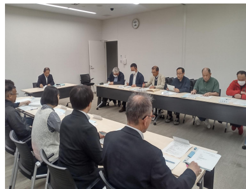
推進協議会の様子 ▲