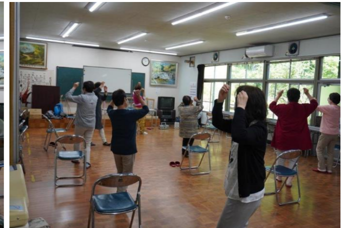
花笠音頭踊り実践