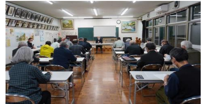
自治協議会第1回理事会