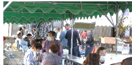
賑わう販売ブース