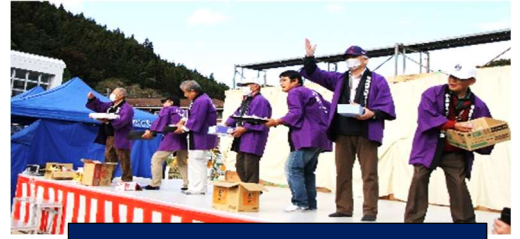
区長会によるふるまい餅まき