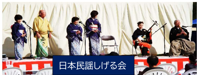
日本民謡しげる会