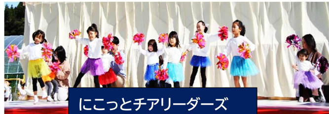
にこっとチアリーダーズ