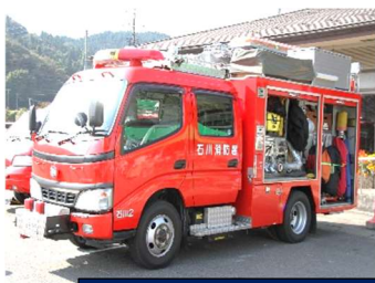
働く車特設会場 乗車体験コーナー