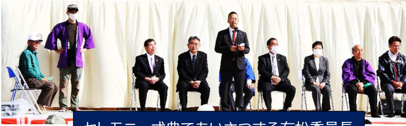
セレモニー式典であいさつする有松委員長