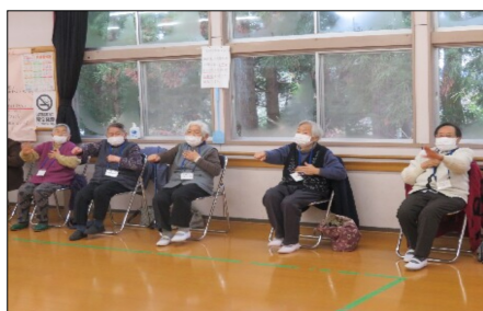
楽しくレクリエーション参加

去る令和8年1月16日（金）に今年度行っております三区長寿会の代表を招集し、3回目のワークショップを開催しました。自らの生活の中で「できること」「して欲しいこと」「地域にあったら良いと思うもの」というテーマに添った内容で意見交換を行った。 今回出た意見を次回第4回目のワークショップで集約し、具体的にできるものを次年度の自治協議会の事業の一つとして結びつける予定。