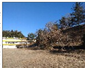
環境整備後の希望ヶ丘