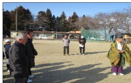
どんと焼きで宮司のお祓い