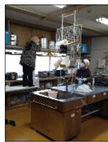
センター清掃の様子

去る令和7年12月7日（日）に毎年行っているサークルひまわりによる年末センター掃除を実施して頂きました。毎年行っている活動であり、皆さん手際よくセンター内の隅から隅まで綺麗に清掃して頂きました。年が明けての令和8年1月12日（月）に和室の障子貼替を行って頂きました。頭の下がる思いでいっぱいであります。本当にありがとうございます。