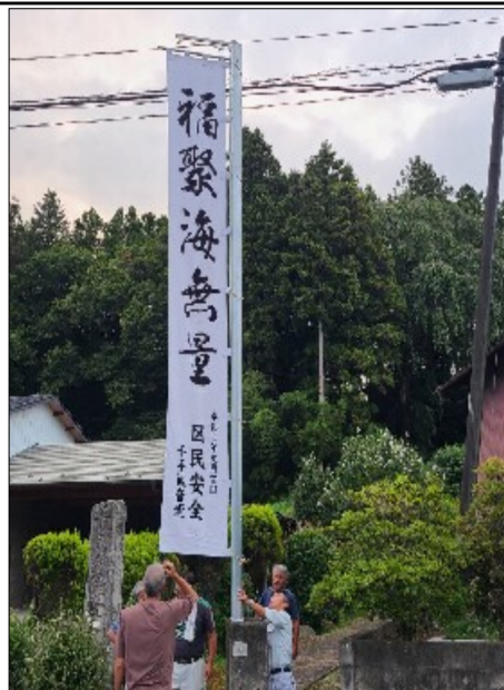
千手観音堂参道に設置