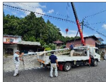
区役員の皆さんの作業ようす

少子高齢化が進む中、持続可能な方法を区役員並びに、消防団の皆さまと協議し今回の運びとなりました。