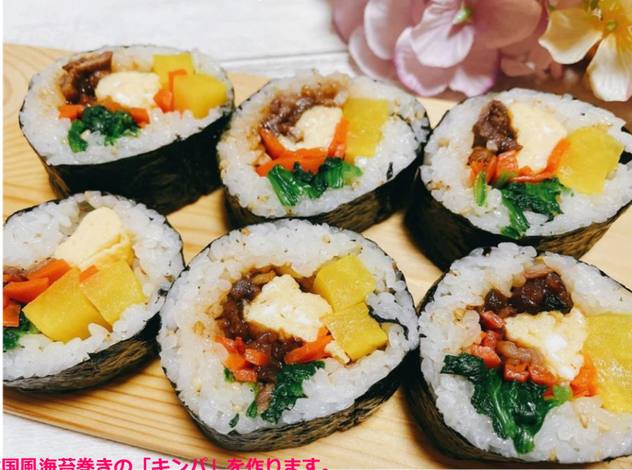
韓国風海苔巻きの「キンパ」を作ります。 具材をカットして、味噌汁を完成させます。