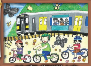
ハシゴライドは楽しいな