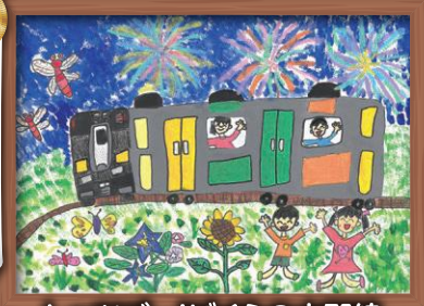
レッツゴー!ぼくらの水郡線