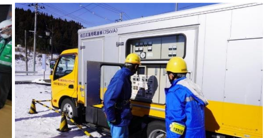
低電圧応急電源車通電準備