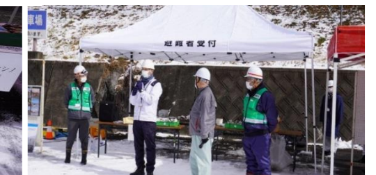
避難所開設訓練作業終了挨拶