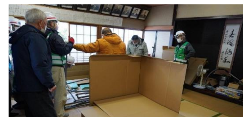
簡易段ボールベッド準備作業