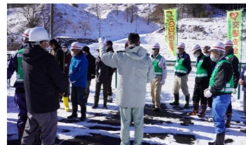
避難所開設訓練開設注意喚起