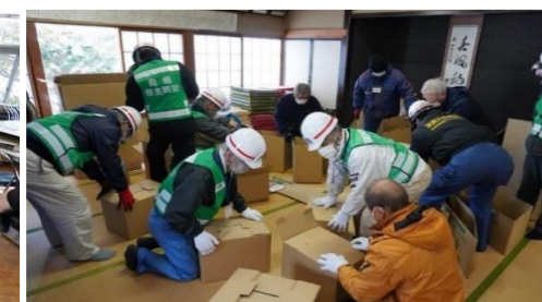
段ボールベッド準備作業