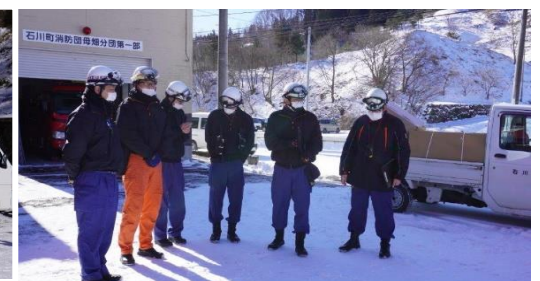
須賀川地方広域消防組合石川消防署