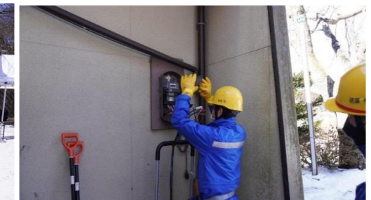
避難所（センター）へ通電準備