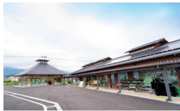
【道の駅足柄・金太郎のふるさと】