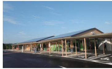
【道の駅木更津うまいたの里】