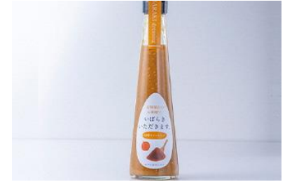
【ドレッシング 味噌】