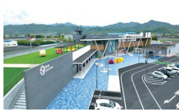
【道の駅くるくるなると】