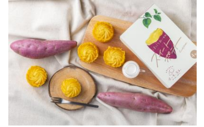
【ほっこりおいものスイートポテト】