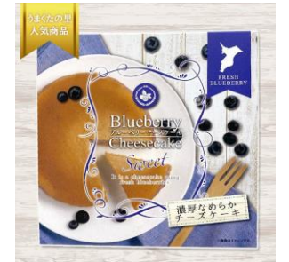
【ブルーベリーチーズケーキ】