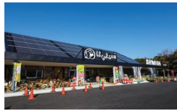
【道の駅ローズマリー公園はなまる市場】