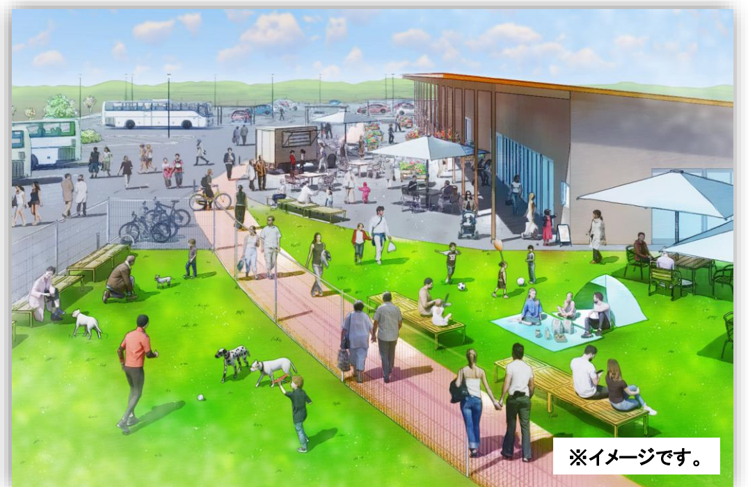
【石川町道の駅鳥瞰図】