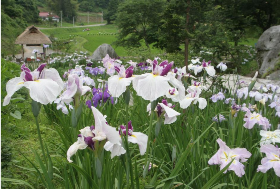
板仲あやめ園（板橋）