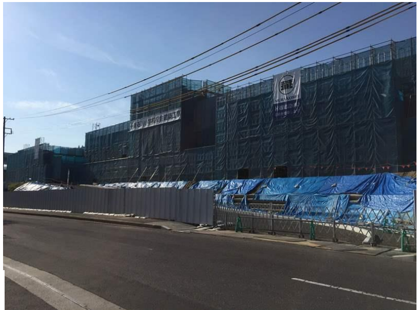
新石川小学校校舎… ただいま建設中！