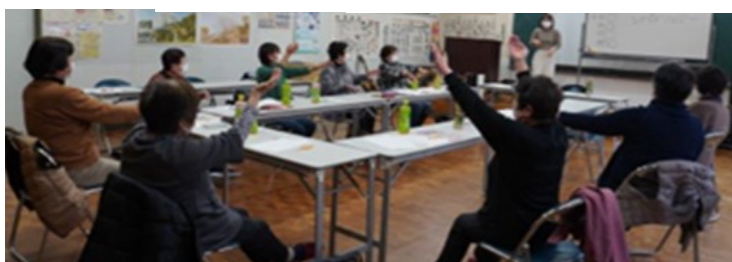
脳トレ体操 (頭・右手・左手!?!?!?バラバラ?)