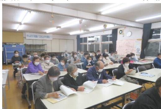
全体会参加したボランティア