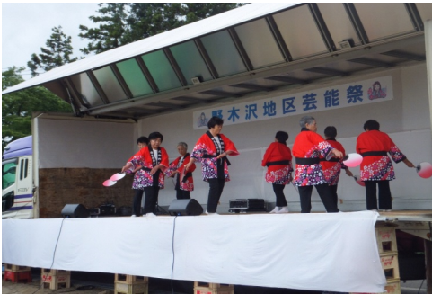
曲木長寿会のみなさん

3年間は、この芸能祭が中止に追い込まれ教室の皆さんの発表の場を設けることが出来ませんでしたが、今回その場を提供