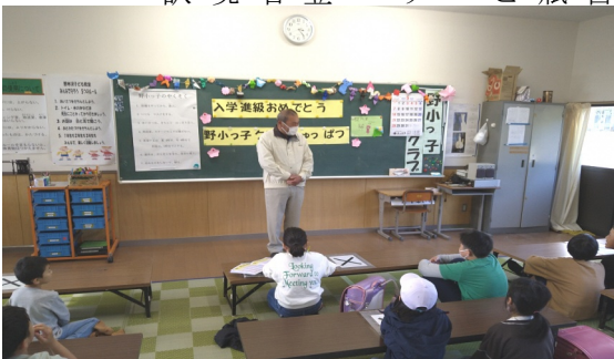
中央二瓶光正野小っ子クラブ会長