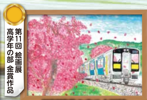
第11回 絵画展 高学年の部 金賞作品