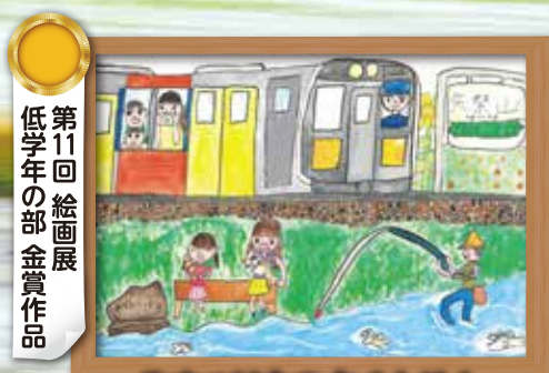
第11回 絵画展 低学年の部 金賞作品