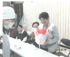
( 誕生日贈呈 )