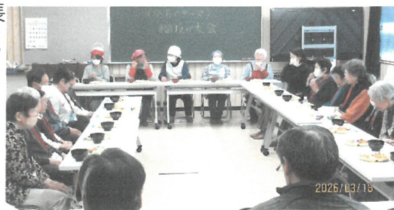
( 入ってくれ～ )