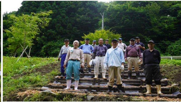
〈完成した擬木階段前で記念撮影〉