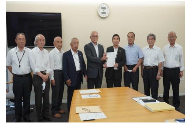
塩田町長へ要望書提出

また、その他町道で整備計画に無い路線や上下水道整備などの定住環境の整備促進を図るため、中山間地域農業農村総合整備事業を活用した取り組みをお願い申し上げます。