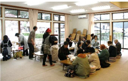
坂路公会堂において昼食、坂路の皆さんよりおもてなしの料理