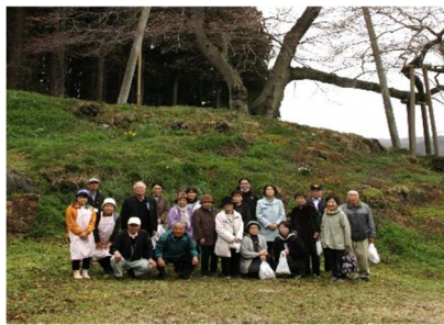
谷沢古内の桜の前で記念撮影をする参加者。