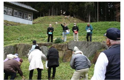
谷沢古内の桜会の皆さんより歓迎受け、お土産まで頂きました