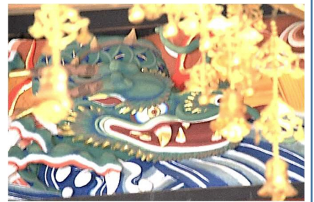
母畑地区にある浄光寺の完成された欄間の色彩