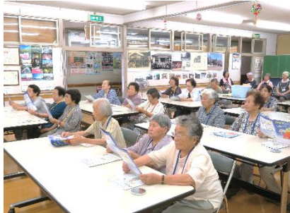
参加者のみなさん