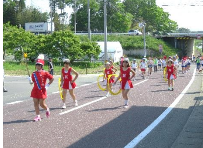
昨年の野小の鼓笛隊

野木沢小学校児童による鼓笛隊が参加しますので区民の皆様、子供たちにご声援をお願い申し上げます。