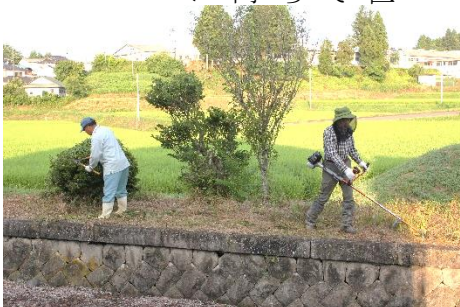
植木の選定と草刈り

少しでも駅を気持ちよく利用していただけるようホームの清掃や垣根の剪定、線路脇の草刈、除草を行いました。