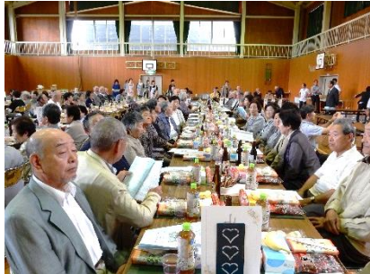
昨年の参加敬老者

野木沢地区の七月二日現在の敬老会対象者は、四百十名で中野百七十名、曲木百十九名、塩沢百二十一名となっています。今年も七十五歳到達、八十歳到達、八十八歳到達、