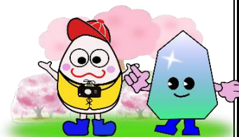
石ころ多ときらちゃん