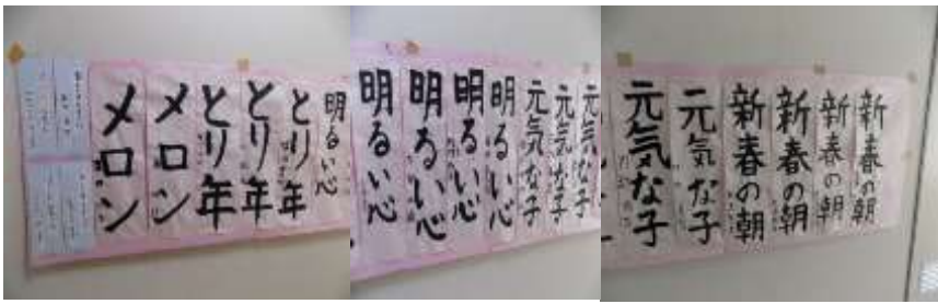
1年生から6年生までの作品