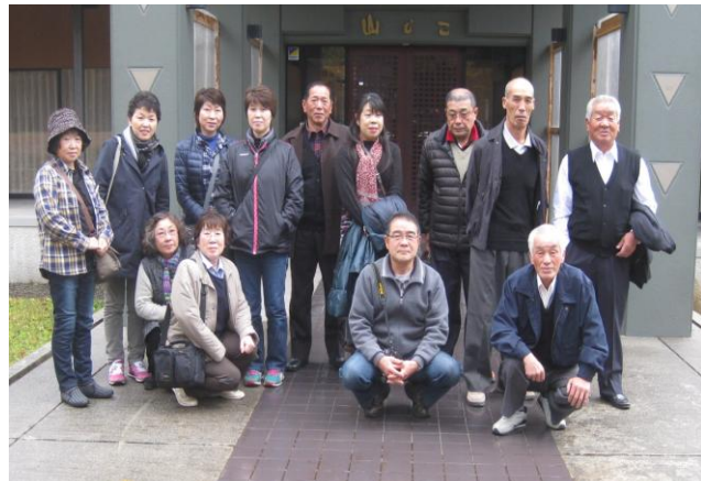
三島町生活工芸館にて