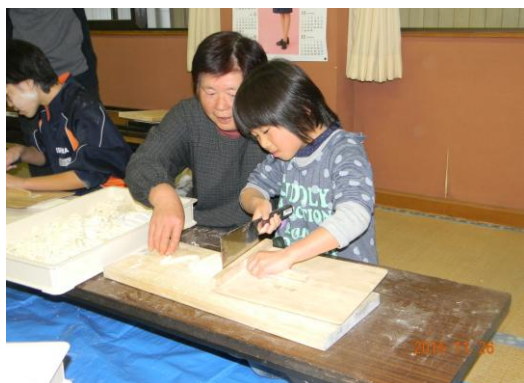
おばあちゃんの指導でうどん切り