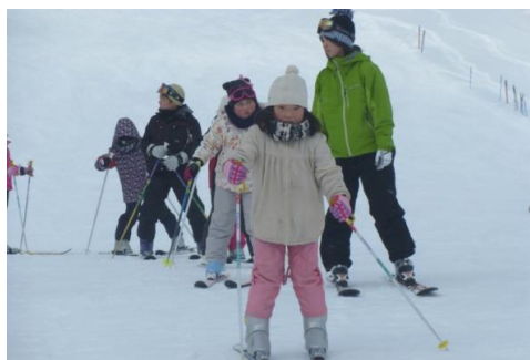
三ノ倉スキー場にて