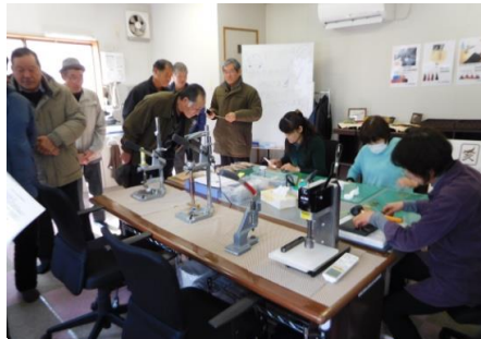
レザークラフト工房見学