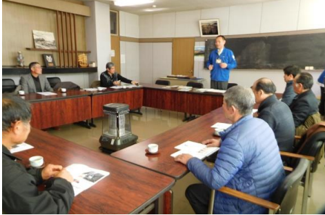
説明を聞く参加者

2月10日（木）母畑レザークラフト教室12名で伊達市農林業振興公社へ見学に行ってきました。伊達市では、イノシシを年間1,000頭から駆除しています。駆除したイノシシをオリジナルレザーブランドとして革製品にし、販売しています。イノシシの革は、豚の革同様に摩擦に強く、軽量で耐久性もあり、そこに柔らかさと通気性にも優れた材質です。