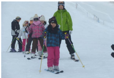
三ノ倉スキー場にて