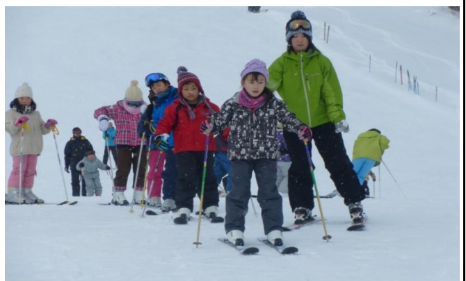
三ノ倉スキー場にて