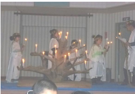
キャンドルファイヤー