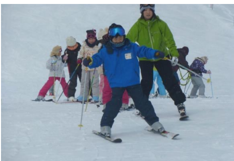
三ノ倉スキー場にて