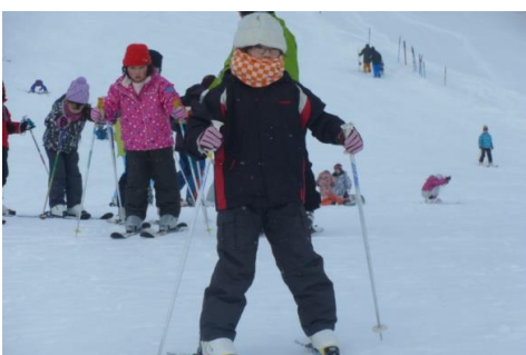
三ノ倉スキー場にて