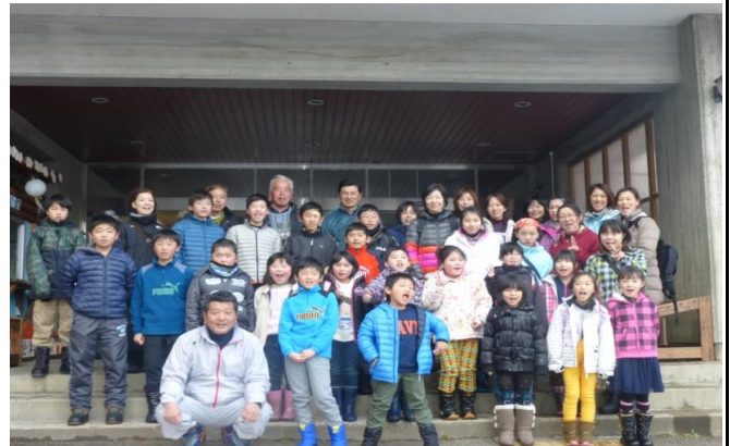
会津自然の家にて全員で記念撮影