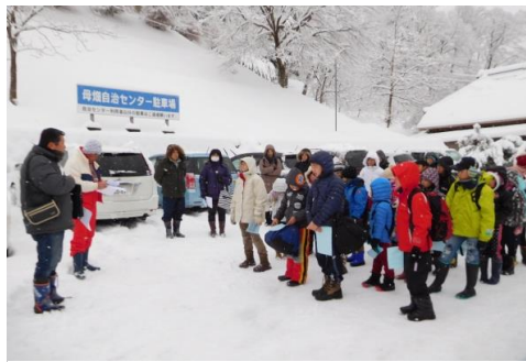
出発式 自治センターPにて