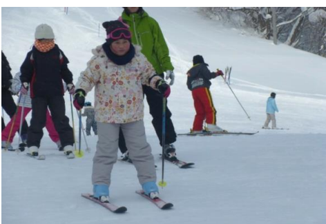
三ノ倉スキー場にて