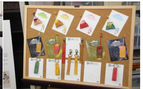
レザークラフト工房の作品