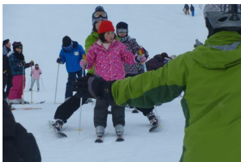
三ノ倉スキー場にて