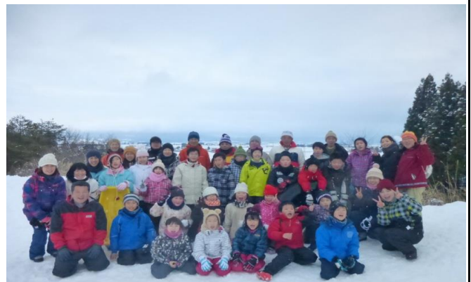
三ノ倉スキー場にて全員で記念撮影