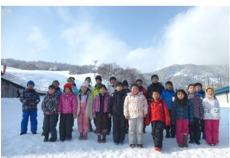
三ノ倉スキー場にて記念撮影