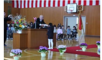
平成 26 年度野小入学式