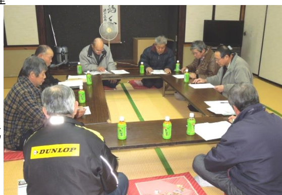
そば打ち愛好会役員会

定期総会は、そば打ち教室終了後に「平成26年度の活動内容報告」、「会計報告」、「監査報告」、「平成27年度の活動計画（案）」と「新役員体制」等が報告される。