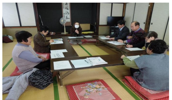
講話(介護について)