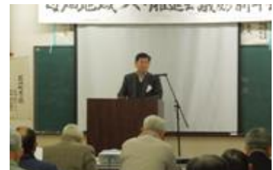
説明する矢内センター長