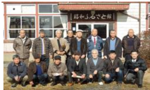
栃木・茂木町 ふるさと館前で記念撮影

1月16日(金)まちづくり委員会主催の先進地視察第2弾で栃木・茨城両県の廃校利用をし、まちづくりをしている2ヶ所を視察して来ました。