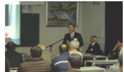
説明する相楽校長