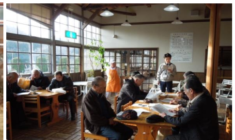
茨城・大子町 おやしき学校で説明を聞く