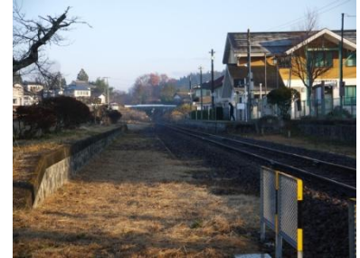
25年度野木沢駅環境整備