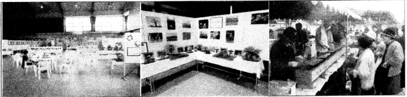
展示作品一般公開

また、『バザー会場』では日用品、農産物などの即売を行い、『うまいものコーナー』には焼きとり、たこ焼き、その他数種の『うまいもの』を準備いたしますので楽しみにご来場ください。