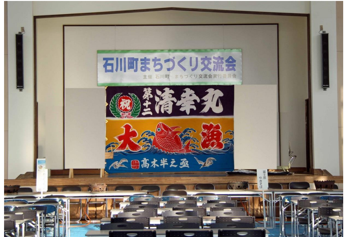
「大鍋大会」会場の体育館には300席を確保、来場者を待つばかり