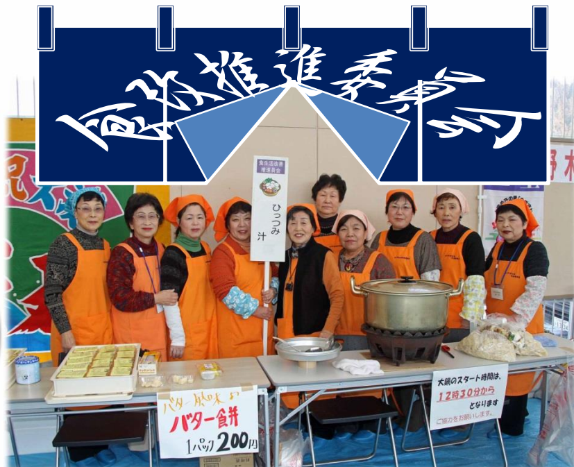
• 元祖「ひつつみ汁」で勝負