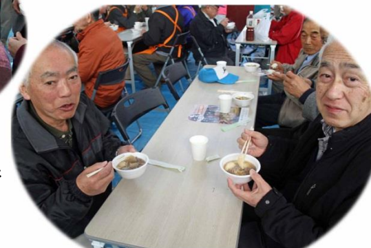
・完売一番乗りの売れ行き