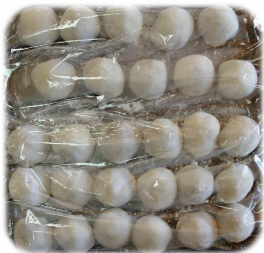
・自信作の「大福餅」