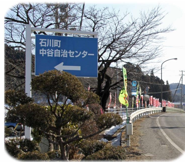
会場を案内する看板と 20 本の幟