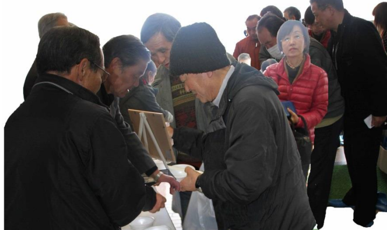
第一部終了と同時に「大鍋大会」の受付が混み合う