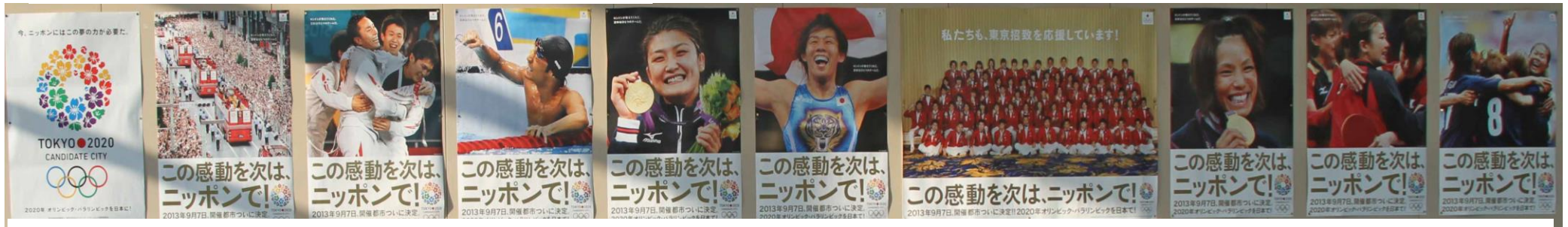
体育館西側上部に張られた東京五輪誘致ポスター（1m × 9m）も雰囲気づくりに一役買う