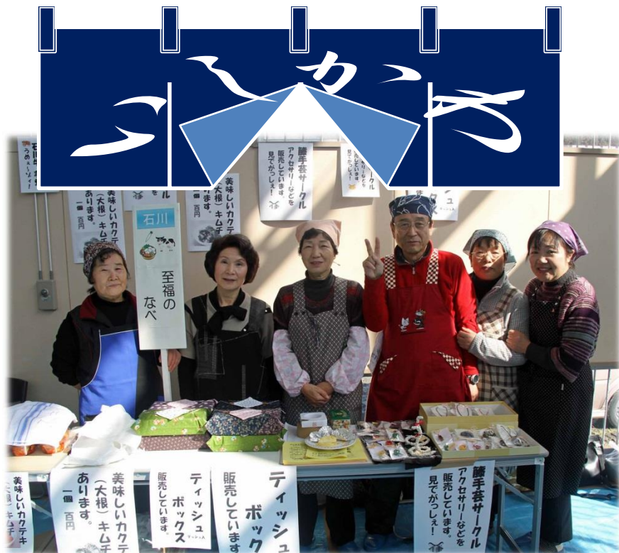
☆「至福のなべ（石川牛）」 ・カクテキキムチ ・藤手芸 ・テッシュボックス etc.