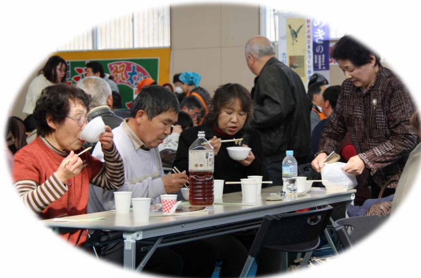
・それぞれの鍋を堪能