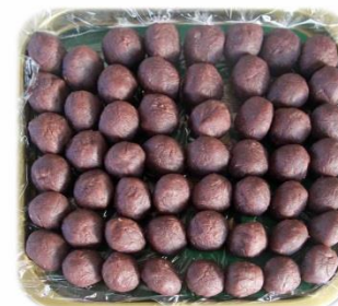
・「大福餅」のあんも美味しそうです