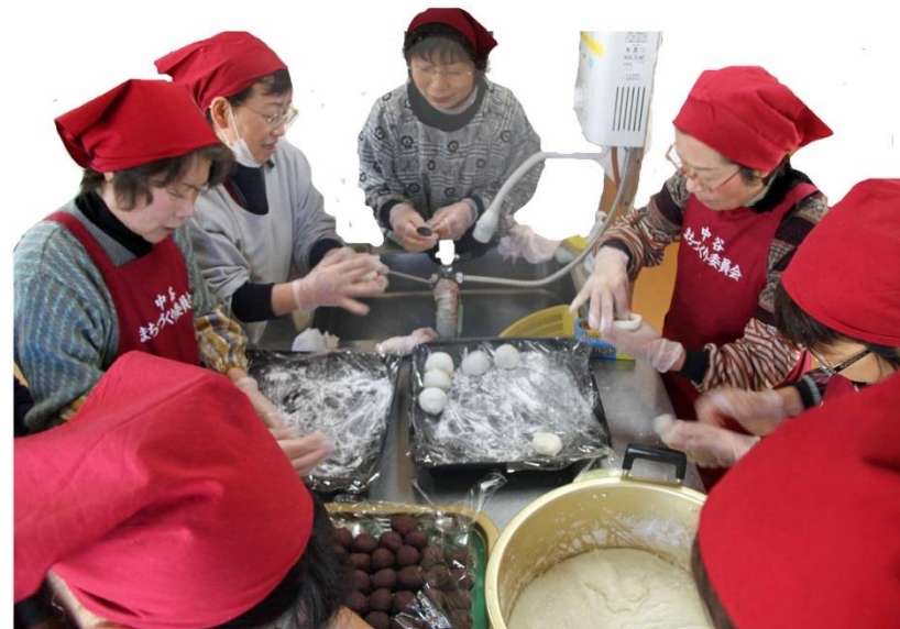
・あっあつの餅であんこを包み手早く丸める