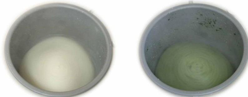
・「大福餅」の餅つき。よもぎ餅の色がきれい