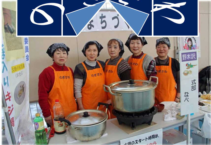
•「式部なべ」 •きゅうりの漬物・紫芋のおはぎ etc.