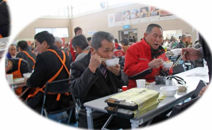
• 飲み物も豊富でした