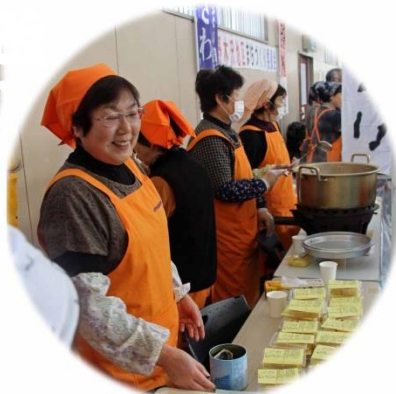
• バター餅がヒット