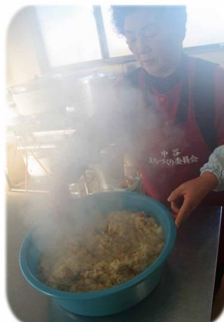
・ふかしたての五目おふかし