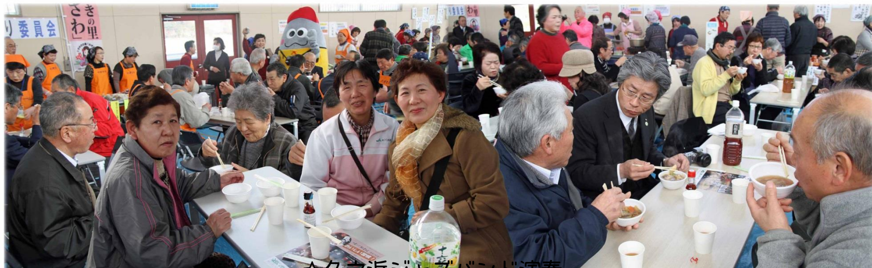
・ご覧の通り 300 席は満席、友人や家族連れでにぎわいました。