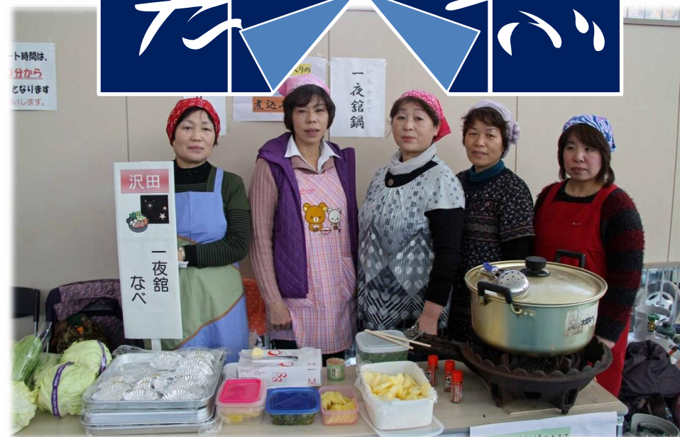
・「一夜館なべ（鳥もつ）」パンチの効いたコクが売りです