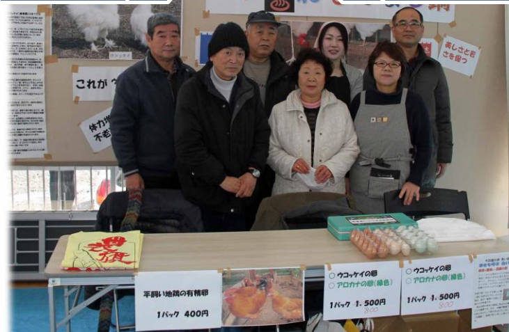
☆「いい湯おもてなし鍋(ウコッケイ)」・ウコッケイの卵 etc.