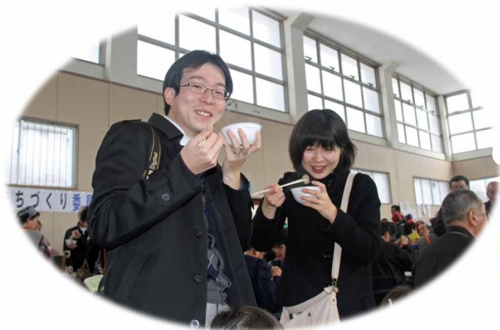
• 座る席がありません