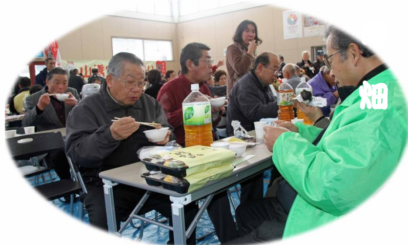
・スタミナ補給には鳥もつが一番です