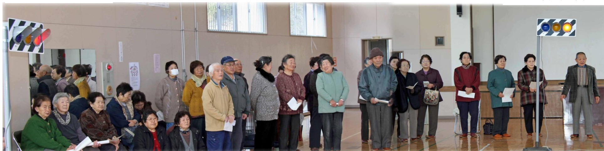
体育館にセットされた信号機を使って行われた「交通安全教室」