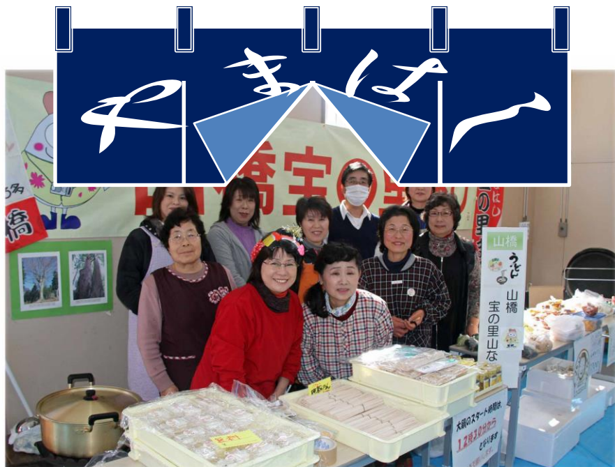
☆「宝の里山なべ(うどん)」・地粉・おにぎり etc.