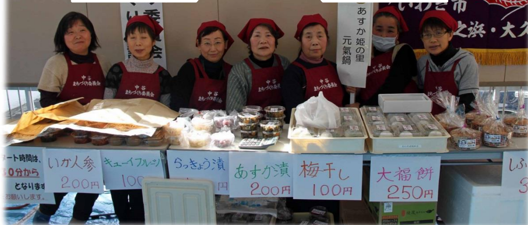
・店頭には「あすかの里元気鍋」の外 大福餅・あすか漬け・キューイフルーツなどが並べられ来客を待つあすか姫たち