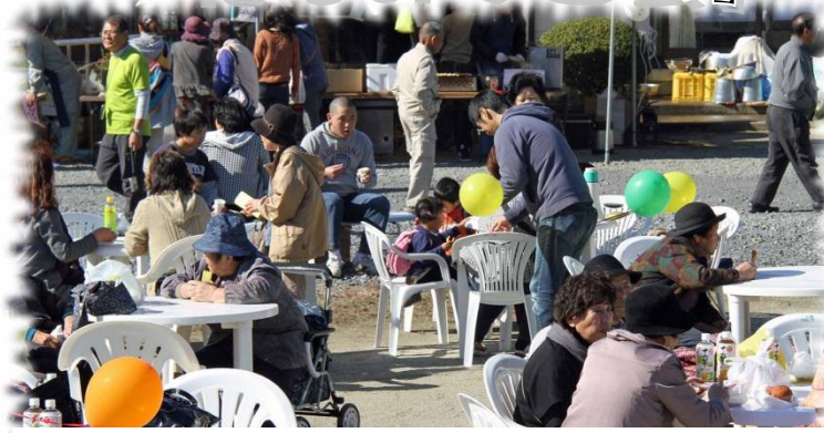
家族連れや友人グループで賑わうステージ前