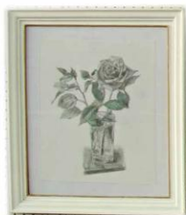
白いバラ 菅井 聡