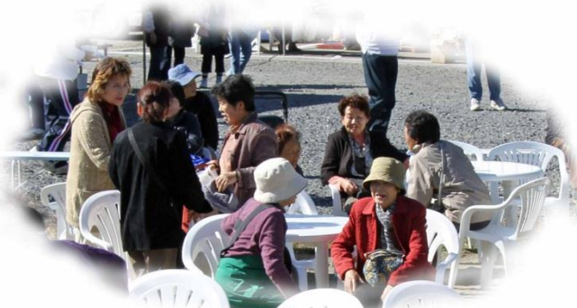
丸テーブルは満席