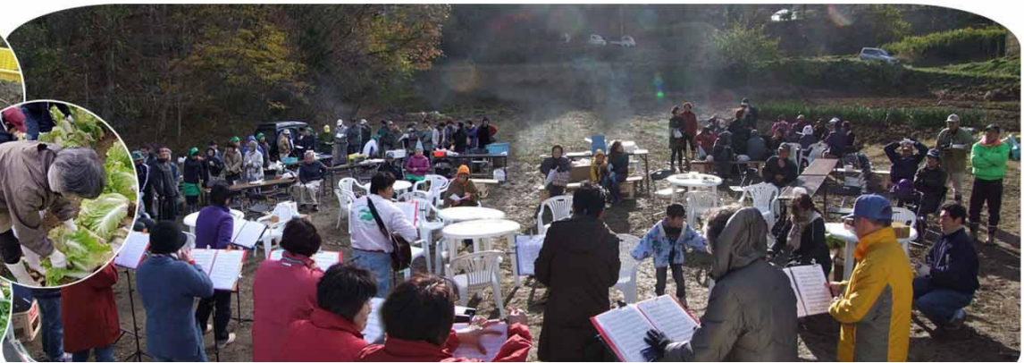
さつまいも、白菜、大根を収穫。 収穫祭には「オカリナ」のライブもありました。