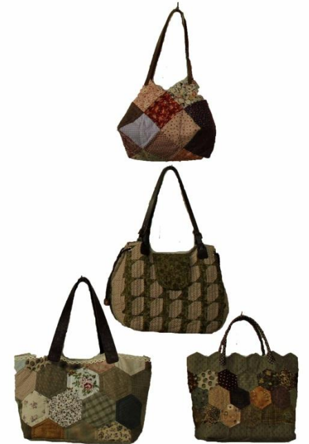
「洗練されたデザイン」