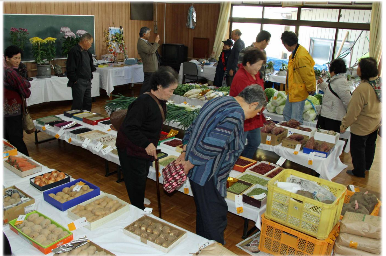
今年も見事な農産物が出品されました。