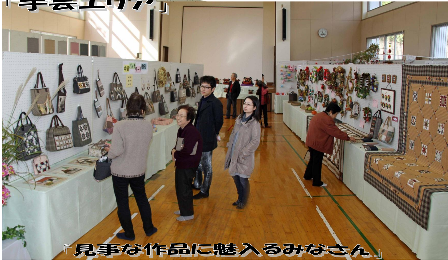
「見事な作品に魅入るみなさん」