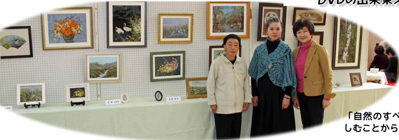
「自然のすべての命を慈しむことから始まる」と