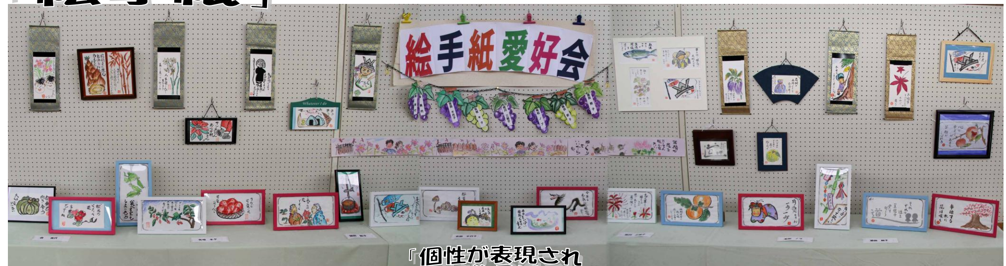
「個性が表現され 楽しい作品ばかり」