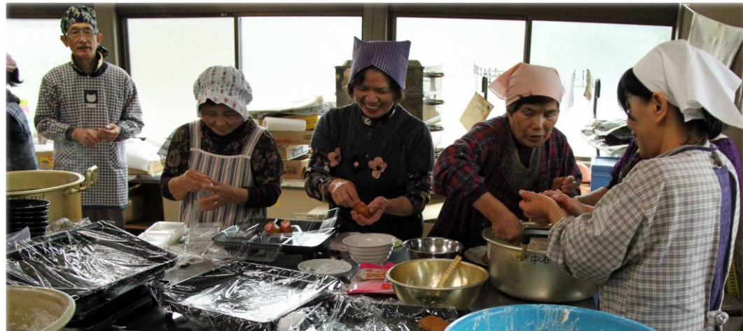
早朝から準備作業するボランティアの皆さん。うどんのほかにも「おいなりさん」「のり巻おにぎり」「天ぷら」づくりを手際よくおこなう。