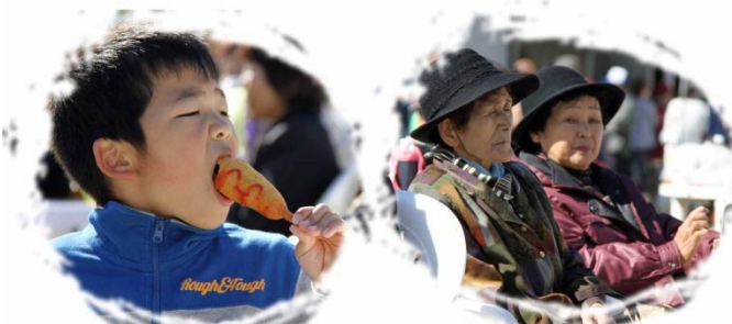
思い思いのスタイルで楽しむ来場者