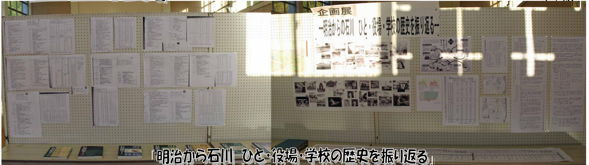
「明治から石川 ひと・役場・学校の歴史を振り返る」