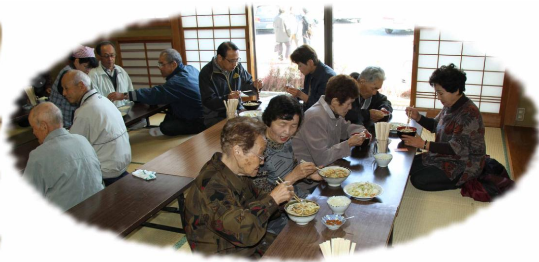
お友達や家族そろって本格的な味を楽しむ。