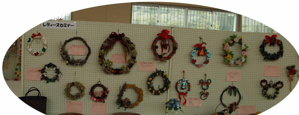
「レディースセミナーのリース」