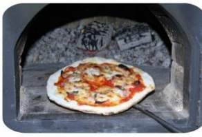
見事な手さばきでピザの生地を延していく。その後各種トッピングして窯で約1,2分で焼き上げる

2) 坂路地区 でも開催。「地域づくりフォーラム」による収穫祭は坂路公会堂を会場に行われました。あいにくの荒れ模様の天候に野外の設営を取りやめ公会堂内での催しとなりましたが今年も餅つき、つき立てのあんこ餅、きな粉餅、焼きそば、けんちん汁などでおもてなし、更に、自慢手作りのパン、野菜などやバザーの販売活動も行い、賑やかな一日となりました。