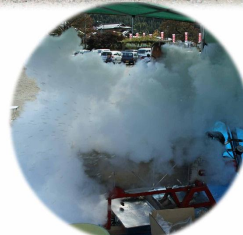
今年も「バクダン」で会場を沸かせました。 爆発の瞬間！