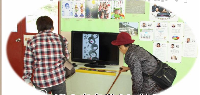
「DVDの出来栄えに魅入る」