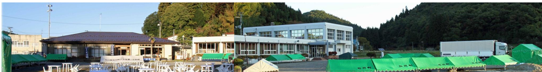
「中谷地区総合文化祭」会場全景