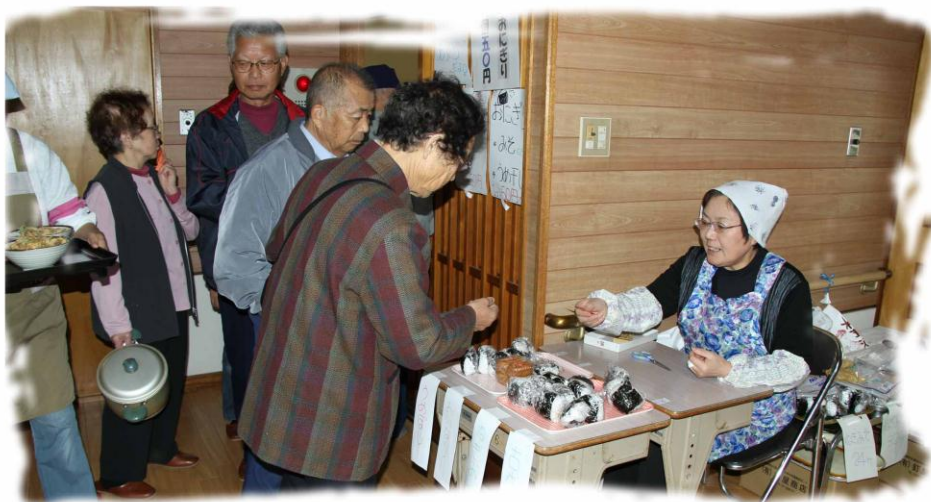
今年も 800 食を完売。ピーク時には廊下一杯に列ができる程。