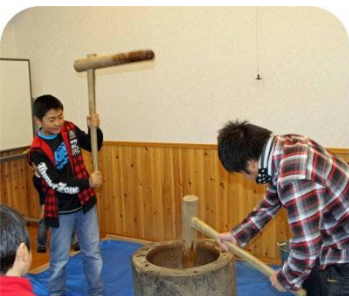
子供たちの「力もち」