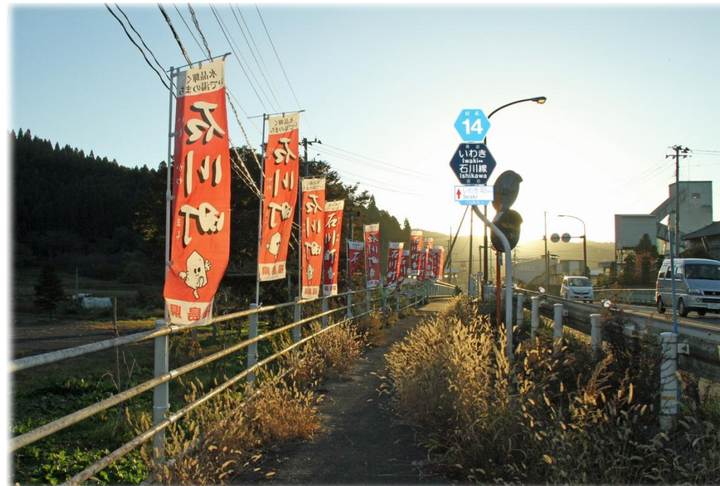
「Well Come」を呼びかける看板(会場入口)と幟旗(里見橋付近)。