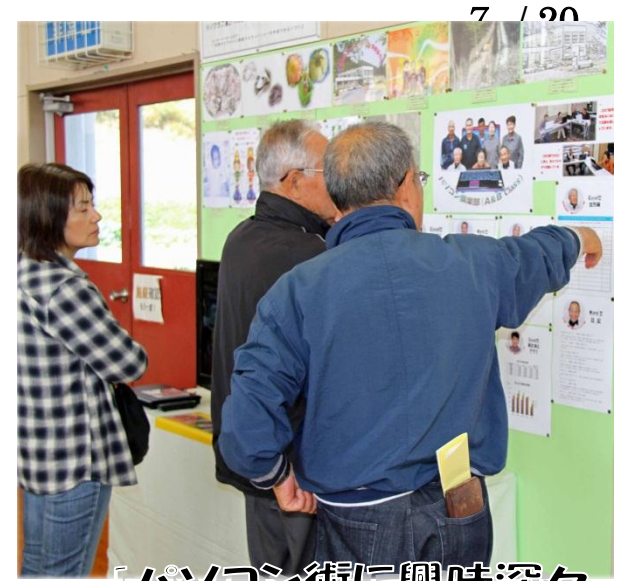
「パソコン術に興味深々」