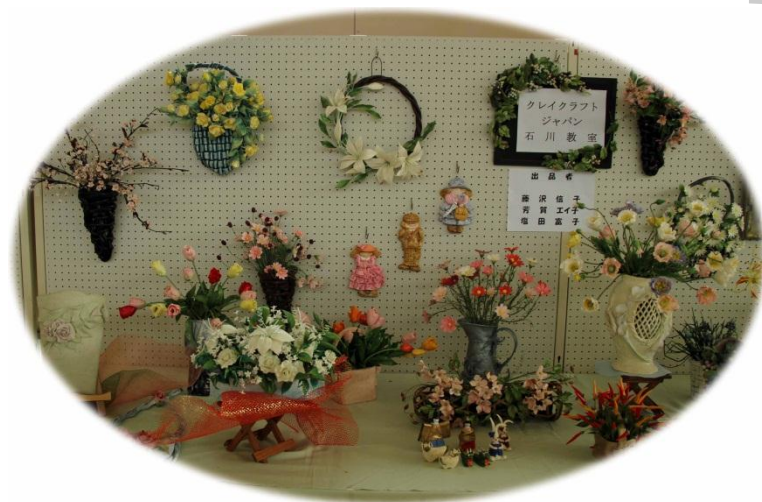
「精密なクレイクラフト」