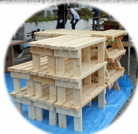
根強い人気の「手作り椅子」