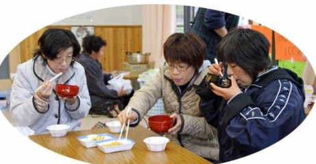
あつあつのけんちん汁に舌鼓をうつ来場者