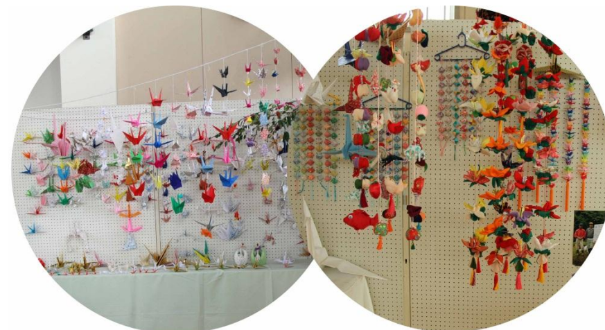
熟年学級「日本伝統 折り紙アート」