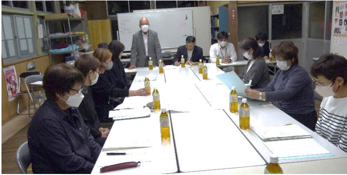
ワークショップ 教育部会の様子

地域自治協議会（松山秀隆委員長）は、令和6年度設立に向けて、3部会の会議が自治センターで、10月11日「教育部会」、18日「安心安全部会」、20日「福祉部会」が行われた。協議事項は、2部会委員から部会名称変更提案があり協議した結果、教育部会が「生涯学習部会」へ、安心安全部会が「地域安全部会」へ変更となった。各部会とも（1）活動内容のすり合わせ。（2）予算の配分について。（3）今後のスケジュールについて、協議した。（1）は、出席者の意