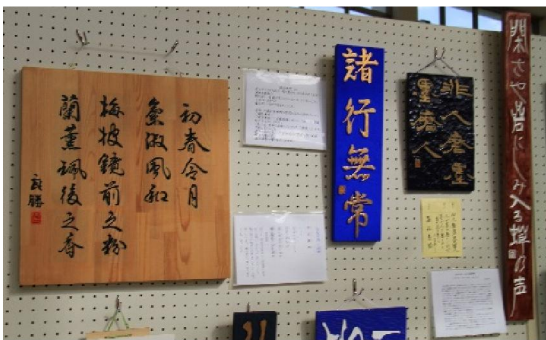
「刻字愛好会」息をのむ作品の数々