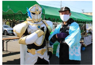
中谷のヒーロー「ペグナイト」