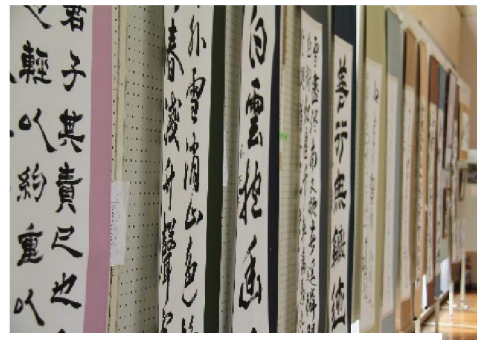
「中谷書道教室」圧巻の筆の勢い