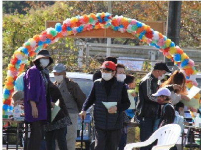
中谷の「花」のアーチの受付