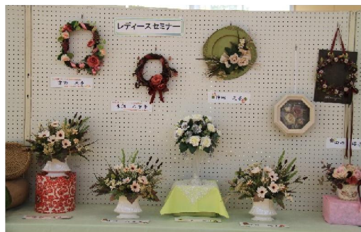
「レディースセミナー」アレンジ花の饗宴