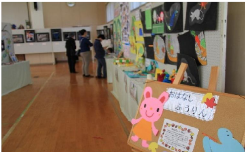
「おはなしふうりん」の手作り紙芝居