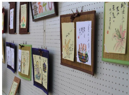
「絵手紙」日常の出来事の一言に共感。…そして癒されます。