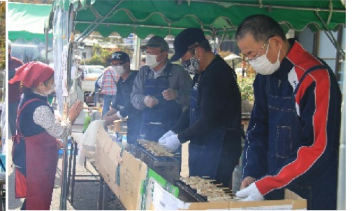
大人気！！メンズのたい焼き・焼き鳥