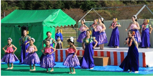
初参加の「えみフラスクール」の皆さん

10月31日・11月1日の二日間 中谷地区総合文化祭が開催されました。今年は、コロナ禍の中での開催となりましたが、運営委員会の皆様・関係団体各位の皆さんのご協力を頂き感染予防を徹底し、実施することができました。