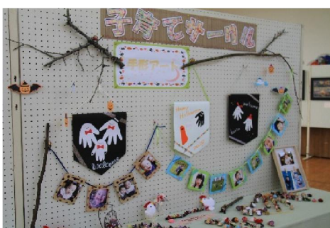
初めての出展、子育てサークルさんの手形アート。この瞬間を思い出に。