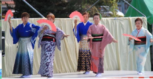
芳柳すみれ会の素敵な舞