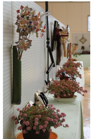
「豊齢学級」精魂込められた作品の数々