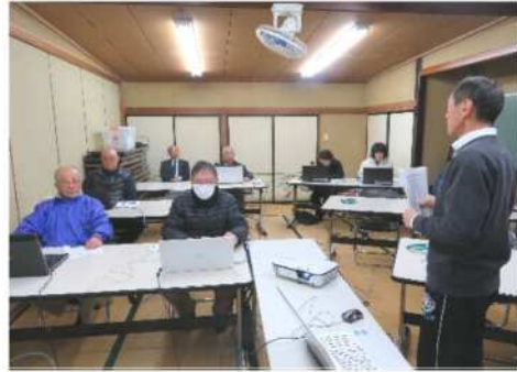
昨年のパソコン教室