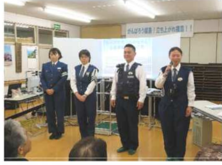
昨年の交通安全教室

今後の状況をみて再開の折にはご利用をされている皆様、関係ボランティアの皆さんには事前で通知しますので今後共ご理解とご協力をお願い致します。