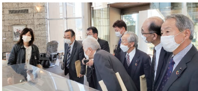
▲道の駅うつのみや ろまんちっく村

宇都宮市の道の駅は、市が運営していた46ヘクタールの農村公園を民間企業に指定管理し道の駅を中心に経営をしており、地域商社としての道の駅を目指しています。道の駅の売り上げは、年8億円です。