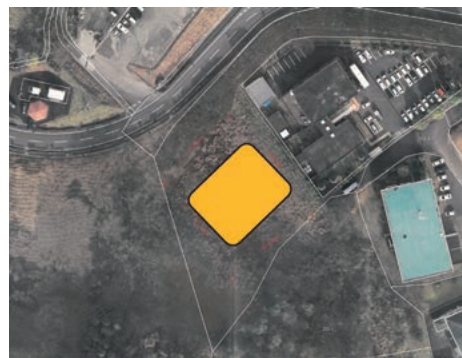
▲ドクターヘリ専用ヘリポート予定地 (字渡里沢地内 保健センター裏)