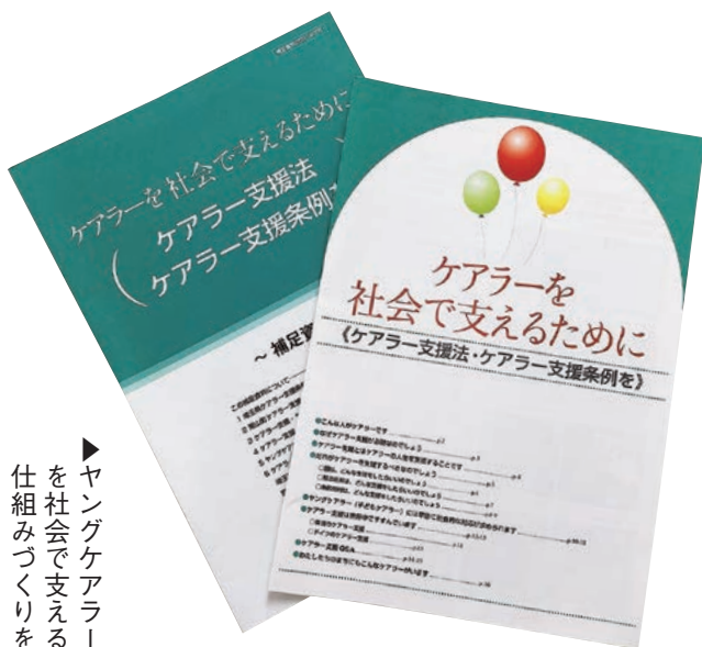
▶ヤングケアラーを社会で支える仕組みづくりを

質問 支援の考えは。 答弁 学校、医療、介護、福祉関係者等が連携し、必要な支援を行います。