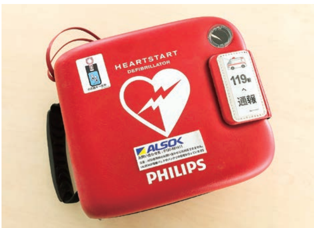
▲モトガッコに設置してあるAED