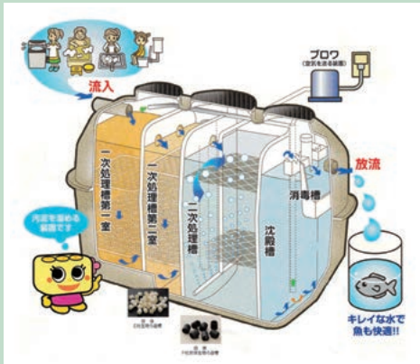
▶浄化槽のしくみ(福島県浄化槽協会)

らす既存住宅への新設や単独浄化槽からの転換設置の促進が課題となっています。台所やお風呂から排出される生活雑排水が環境に与える影響を丁寧に説明しながら、少しずつ合併処理浄化槽の設置を推進していきたいと考えています。