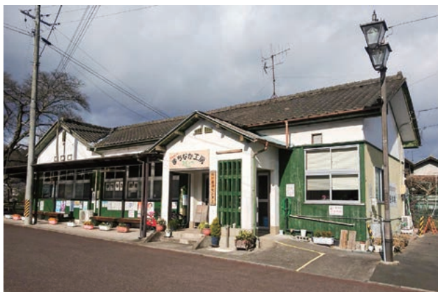
▲石川自治センター