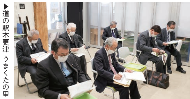
▶道の駅木更津うまかつの里

どちらの「道の駅」も地域資源中心の商品開発と「地産外販」の経営に優れ、商圏は、近隣市町村を含め10万人以上であり、地域の流通と交流の拠点となる「地域商社型」を目指しています。