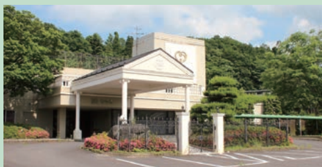
▲令和5年の開館に向け工事が始まる旧ホテル松多屋