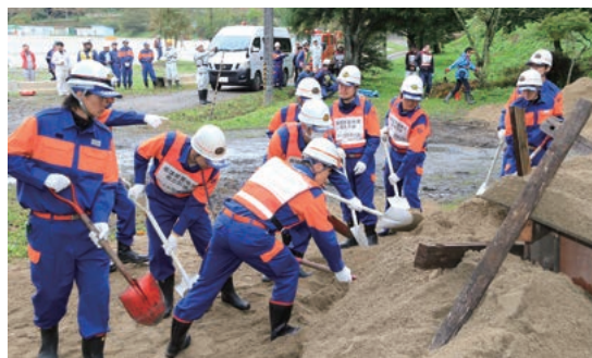
▲過去に行われた県中地方総合防災訓練 (平成29年10月)

り、これらと交差する地点での高さが制限されるため工事が極めて困難であり、断念したところです。しかし、川岸の浸食や土砂堆積、雑木の繁茂などにより環境が悪化しているため、早期に堆砂除去等を行うなどして維持管理に努めます。