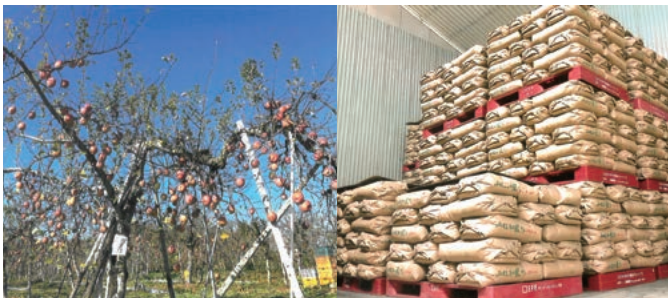
▲倉庫に山積みされている令和2年度産米(12月撮影)(右)、凍霜害等により収穫量が減った特産品のリンゴ(左)

意見 農業を取り巻く環境は、年々厳しくなっている。持続可能な農業が進められるようすべきである。