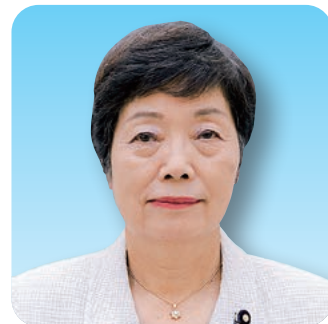
瀬谷 京子 議員