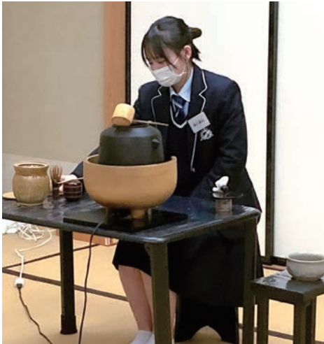
▶茶道を通して作法を学ぶ姿

二つ目は、しっかりととした作法や言葉遣いを身に付けるということです。接客業ということで言葉遣いや作法は特に重要なことだと思っています。自分の言葉遣いや作法が足りない点でお客様を不快にさせないよう、また、気持ちよく過ごしてもらえようように平日頃の生活から気を付けて過ごしていきたいです。