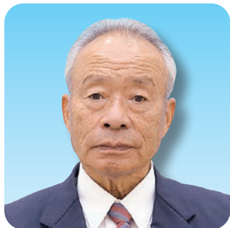
関根 信次 議員