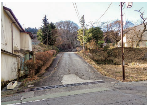
▲改修予定の旧母畑小学校跡地進入路