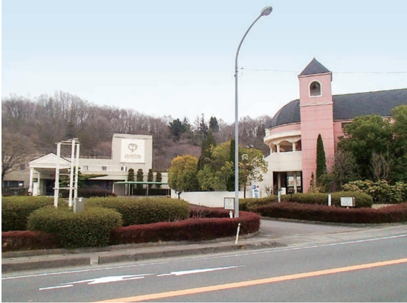
▶歴史民俗資料館として整備される旧ホテル松多屋

令和3年12月定例会は、12月2日から10日までの9日間の会期で開かれ、条例案件2件、補正予算4件、路線の町道認定1件、請願1件、議員発議1件の合計9件を審議しました。 一般質問には、9人の議員が登壇し、町政を問いました。また、41人の傍聴がありました。