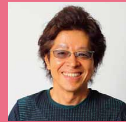
写真家 テラウチ マサト 氏

●プロフィール 自然とアートが調和したリゾートホテル「二期倶楽部」代表取締役。ほかに千鶴が海王芸術キャリア「冊」を開発するなど、文化事業を手がける。