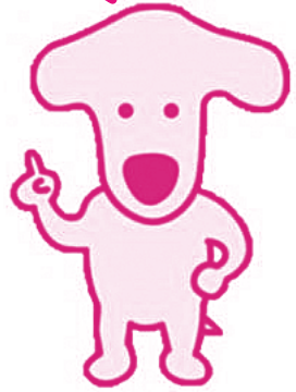
あぶくま高原道路 マスコット 「とうろく君」