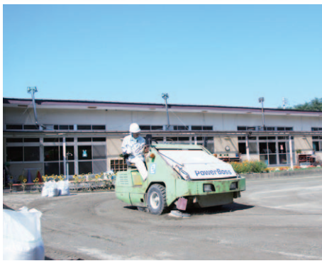
▲ロードスイーパーで表土を除去しました