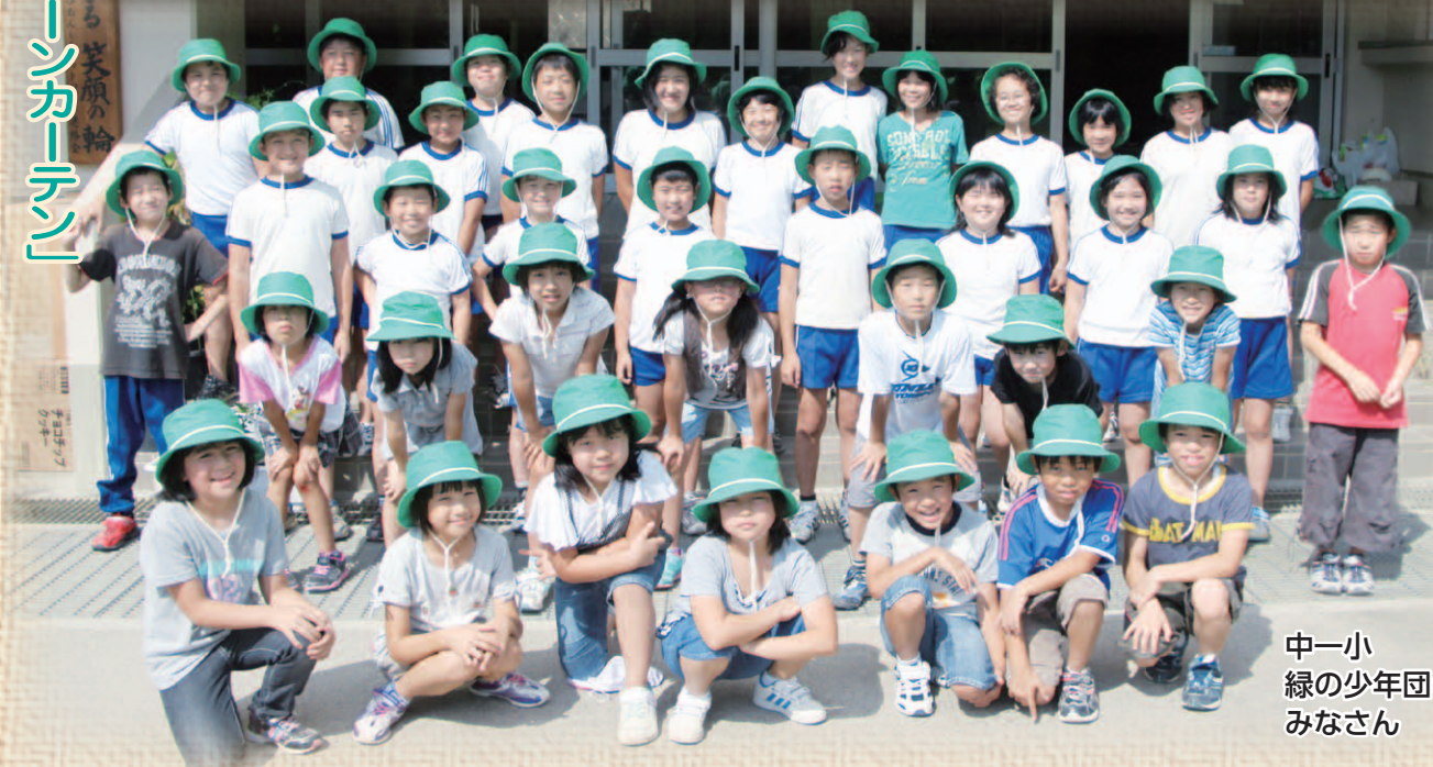
中一 緑の少年団の みなさん

中谷第一小学校のペランダには、アサガオのグリーンカーテンが作られています。「変化アサガオ」という、ちょっと変わったきれいなアサガオです。子ども達が毎日水をあげながら大切に育てています。