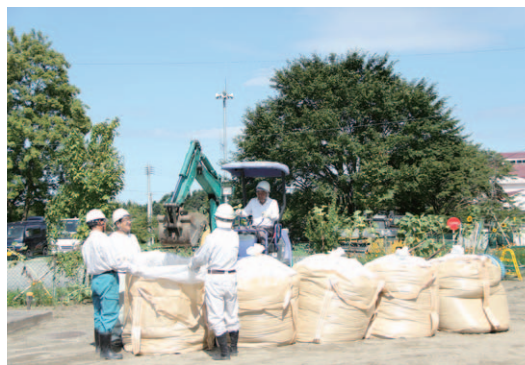
▲除去した土は袋に詰めて移動し保管しました