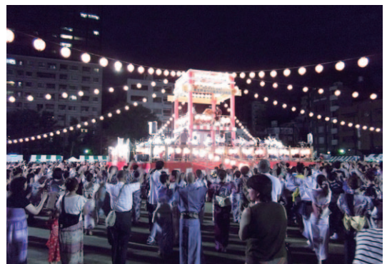
▲たくさんの人出で賑わう会場

町内で2店舗の直売所を運営。季節の「産地直送すいか」や「オリジナルりんご」とまとジュースを出品。