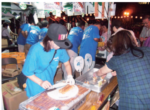
▲お菓子も人気でした