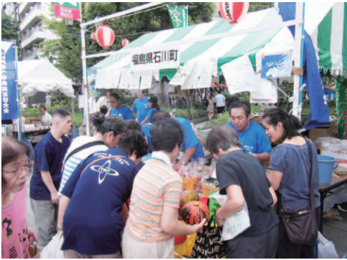
▲石川町のブースも賑わいました

風評被害対策として町内の農業者や商業者などが首都圏で石川町の製品の安全性をPRする「トップランナー・Shikawaプロジェクト」では第2弾の活動として8月26日～27日、東京都中央区で開催された「第22回大江戸まつり盆おどり大会」でブースを出店しました。このまつりは8万人超の観客が訪れる大きな盆踊りですが、26日の初日は、時間雨量80ミリを超える豪雨により残念ながら中止となりました。翌27日も曇り空で雨が心配されましたが、天気は持ちこたえ、会場は大勢の人で賑わいました。