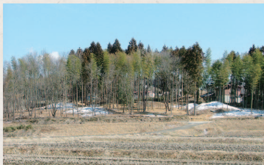
▲大檀古墳群の主墳（全長39メートル）

石川町域は白河国造の支配下にあつたと考えられており、六世紀後半から七世紀にかけての築造とされる大