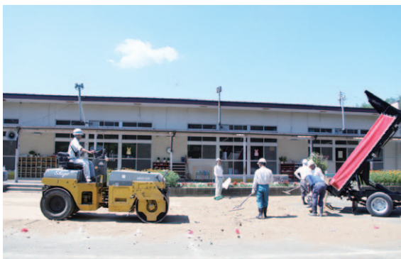
▲山砂を敷き、転圧しました