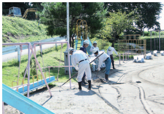
▲遊具の下は手作業で表土を除去しました