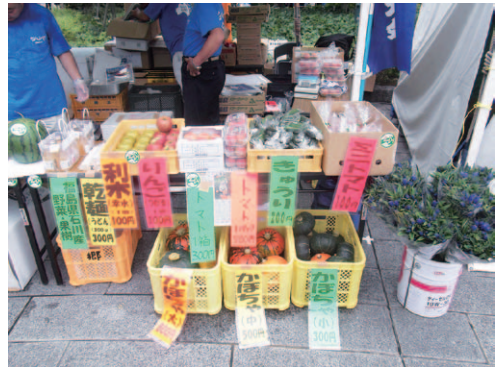
▲新鮮な野菜を出品しました

風評被害対策として町内の農業者や商業者などが首都圏で石川町の製品の安全性をPRする「トップランナー・Shikawaプロジェクト」では第2弾の活動として8月26日～27日、東京都中央区で開催された「第22回大江戸まつり盆おどり大会」でブースを出店しました。このまつりは8万人超の観客が訪れる大きな盆踊りですが、26日の初日は、時間雨量80ミリを超える豪雨により残念ながら中止となりました。翌27日も曇り空で雨が心配されましたが、天気は持ちこたえ、会場は大勢の人で賑わいました。