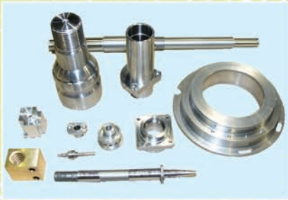
▲同社で生産された製品