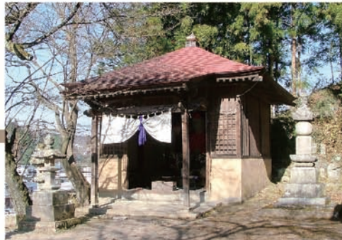
③32段の階段を登ればお堂に到着。境内には14世紀代の板碑6基もあります。