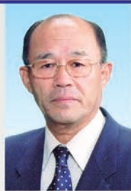
◆ 石川町 ◆

皆さまには、昨年中、町議会にお 寄せいただきましたご支援に対し、 厚く御礼を申し上げますとともに、 平成23年の年頭にあたり、謹んで皆 さまのご健勝とご多幸をお祈り申し 上げます。