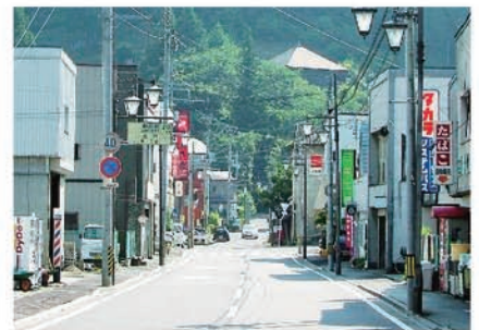
①馬場町通りを直進し立ヶ岡方面へ向かいます。

中世期に地藏堂の上にあった寺院の住職が、近くで処刑された人々を埋葬して手厚く弔うため、この地藏尊が造られたと伝えられています。別名「首切り地藏」とも呼ばれます。巨大な花崗岩を加工して造られており、高さは2.7mを超えます。昭和32年頃に補修されて現在の姿になりました。なお、本尊を後世に伝えるため、地元有志による保存会も昨年設立されました。