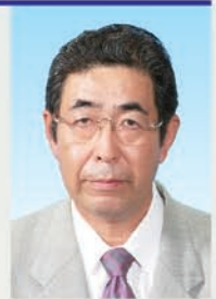
◆ 石川町議会議長 ◆