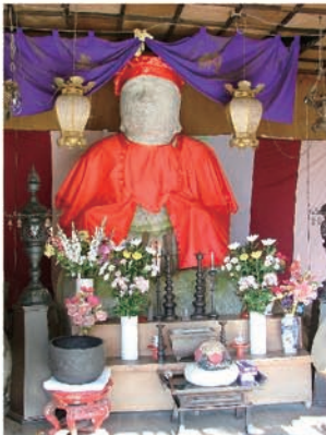
④天井に頭が届くほどの巨大な姿は圧巻です。