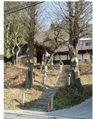
②道なりに行くと左手にお堂が見えてきます。2本のイチヨウが目印です。