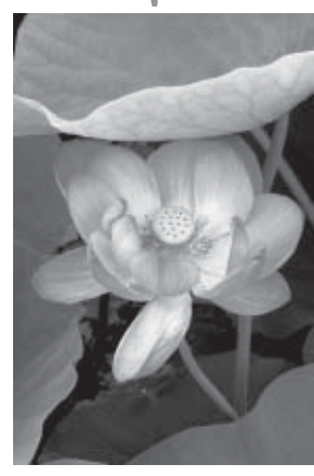
葉の間からかわいらしく顔をのぞかせる花 昨年7月中旬)