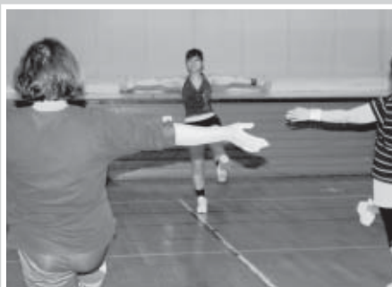
インストラクターの指導で楽しく