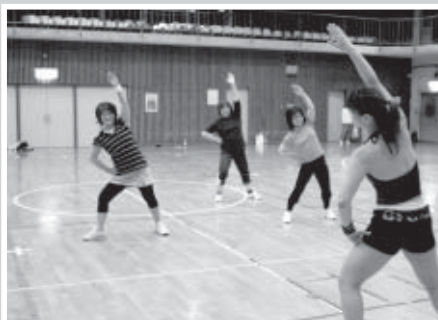
音楽にあわせてリズムよく