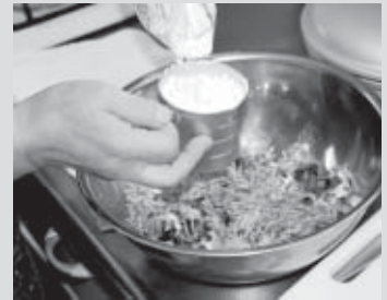
桜えびをたっぷり

ボールに切った材料と桜えびを合わせる。 にお好み焼き粉、卵、塩、牛乳を加えてよく混ぜ合わせる。 熱したフライパンに油を薄くひいて、をスプーンなどで食べやすい大きさに形作り、蓋をして弱火で焼く。 こんがり焼き色が付いてきたら、裏返し両面を焼く。 お皿に盛り付け、ソースやマヨネーズをかける。