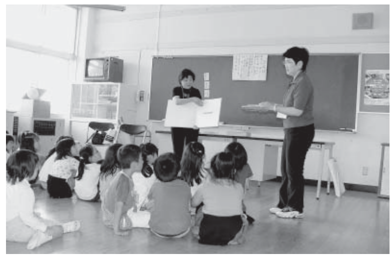
ボランティアによる読み聞かせ

今年度は沢田小学校と野木沢小学校の2校で教室を開設し、小学1年生から3年生を対象に週1回、町内のボランティアグループや地域の方々の協力を得て、読み聞かせや紙芝居など読書活動を主とした取り組みを行っています。また、遊びを取り入れながら子ども達に様々な体験活動を提供しています。