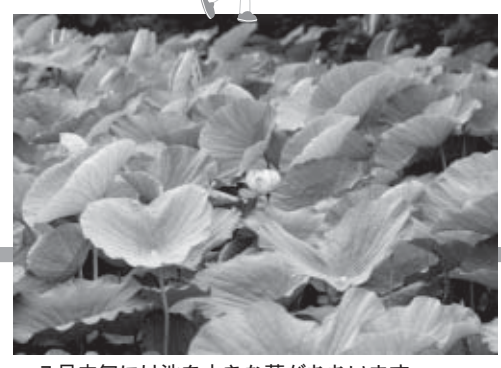
7月中旬には池を大きな葉がおおいます