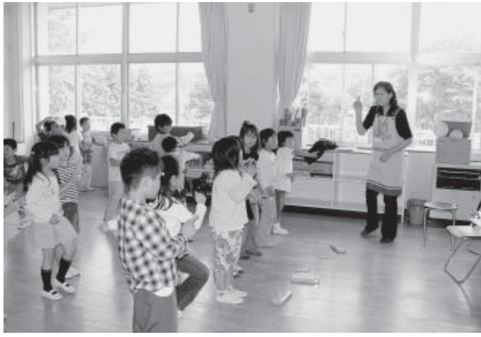
ダンスをまじえて歌をうたいました

教育委員会では、放課後の子どもたちの新たな活動拠点として放課後子ども教室を開設しました。この教室は、放課後に学校の余裕教室を活用して、地域の方々の協力を得て、子ども達とともにスポーツや文化活動、地域住民との交流活動等を実施し、子ども達が地域社会の中で、心豊かに健やかに育まれる環境づくりを推進するものです。