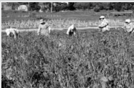
今年も豊作でした