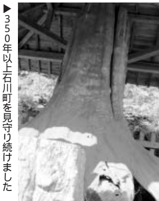
350年以上石川町を見守り続けてきました