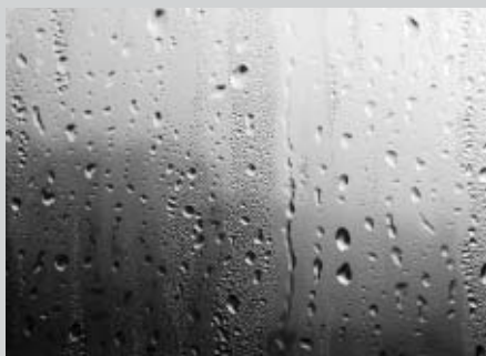
カビなどの原因になる結露

空気は温度が高いほど多くの水蒸気を含むことが出来ます。室内の暖かく湿った空気が戸外から冷やされた窓で急激に冷やされ、水滴となつて現れるのが結露です。結露を防ぐためには、必要以上に部屋の温度を上げないこと、適当な換気、水滴をこまめにふき取ることも効果的です。