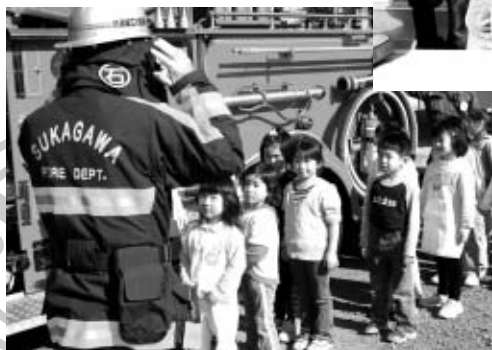
◀消防士さんカッコいい!