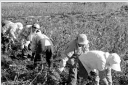
一番うれしい収穫作業