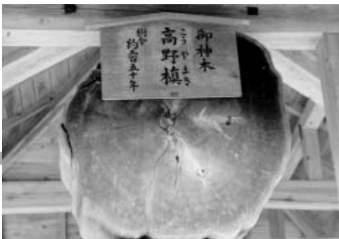
頭上につるされた断片は年輪を見ることができます