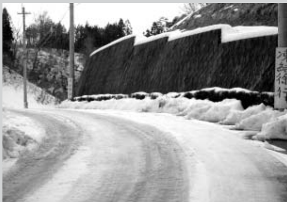
山合の日影には、雪が残る

家族みんなが事故なく安全に帰宅することがどんな暖房器具より暖かいことでしょう。安全安心の地域は一人ひとりの心構えが大切であることを自覚しハンドルをにぎりましょう。