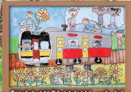
「ひまわりばたけをはしたよ」