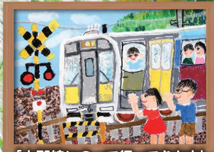
「水郡線にのって行ってきます」