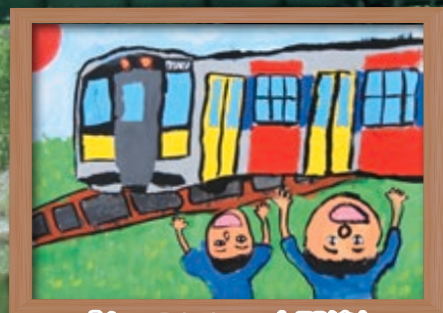
「かっこいい 水郡線」