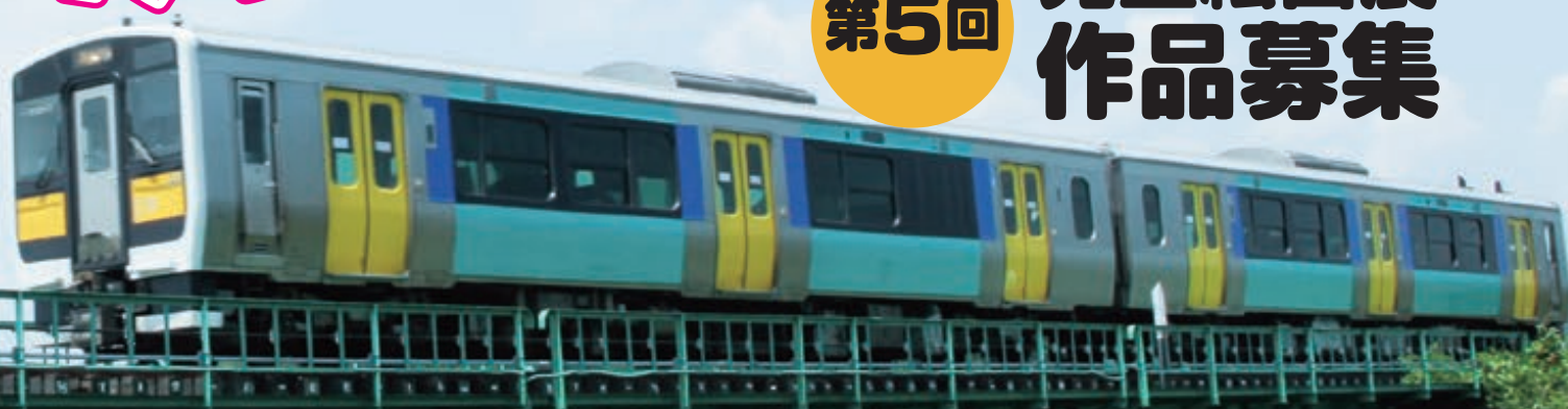
第4回 絵画展 低学年の部 金賞作品