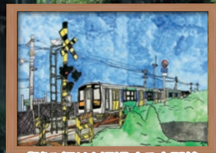
「踏み切りを通過する水郡線 (常陸青柳駅にて)」