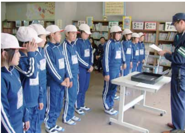
▲家庭の交通安全推進員委嘱状交付（母畑小交通安全教室）