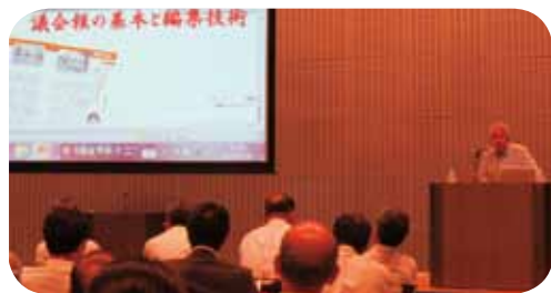
▲読んでもらえる議会広報とは

「表紙写真の重要性」、「行政用語ばかりにならないか」、「引きつける見出し」などを学びました。 研修を生かして、今後の広報編集に努めていきます。