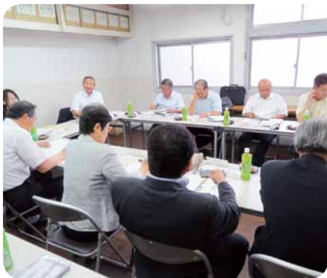
▲議会報告会をもっとよくしたい

6月21日、栃木県高根沢町議会が、視察研修に来町しました。 高根沢町には、文教厚生常任委員会の研修で伺ったことがあります。 高根沢町議会は昨年、