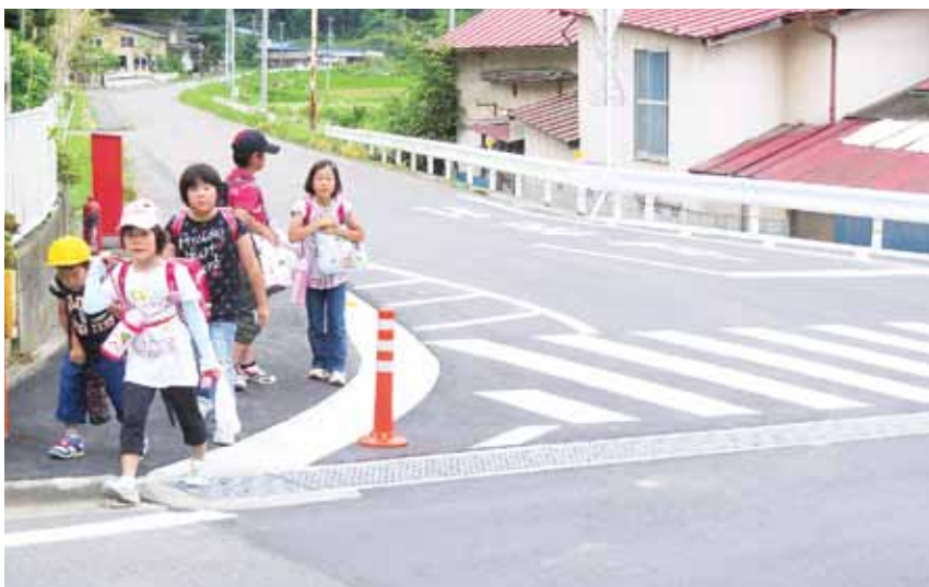
▲道路が改良された箇所（山形字須沢地内）