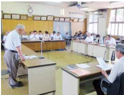
▲参考人から請願の趣旨を聞く

開かれた親しまれる庁舎が建てられ、防災の拠点になることを望んでいる。4候補地の中で一番条件を満たすのが長久保であった。反対する。（下山田）