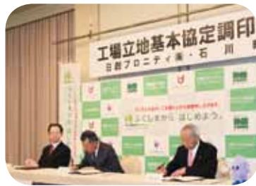
▲待望の企業誘致がきまる