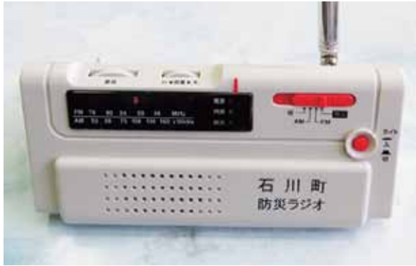
▲貸与される防災行政ラジオ

● 防災行政ラジオは、通常はラジオとして利用できませんが、町からの防災行政無線が発信された場合は、優先的に防災行政無線を受信できる構造となっております。 町では、本格的な導入に向けて検討してきました。 平成24年度に、防災行