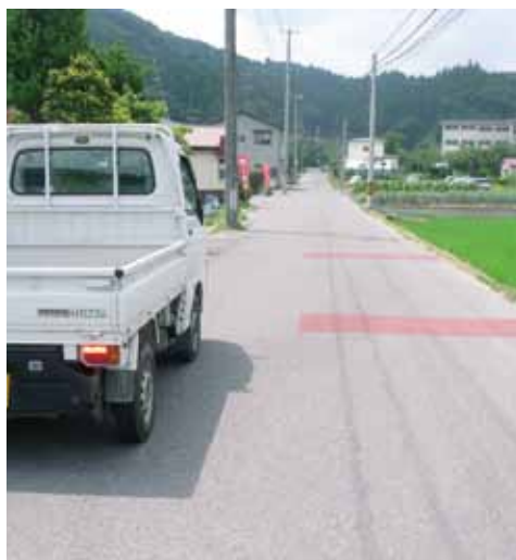
▲学校統合のため町道115号線の改良を

連携し、会議も工夫します。 【質問】 行政区とも積極的に話し合いを持つべきと思う。委員会答申に対する町長の考えは。 【答弁】 答申はきちんとしていきたいと思います。 【質問】 事業進行の議会報告は。 【答弁】 報告します。 【質問】 市街地に相談室を設置し、行政サービスの向上を。 【答弁】 検討します。 【質問】 高齢者など交通弱者は心配している。検討では困る、是非実施を。 【答弁】 重要な課題として、検討します。 【質問】 新庁舎を中心とした道路の整備が必要、考えは。 【答弁】 国道118号から右折レーンを設置し、進入を容易にします。将来は警察署脇からの町道220号への接続を図り、長久保から北町へ通じる町道219号も整備します。 また、路線バスや町のマイクロバスの活用を検討