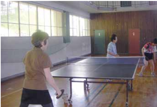
▲町体育館で卓球を楽しむ方々

るべきではなかったのか。 答弁 手続きを踏むのが筋でありましたが、今後審議会を立ち上げ、話をしてご理解をいただきませ