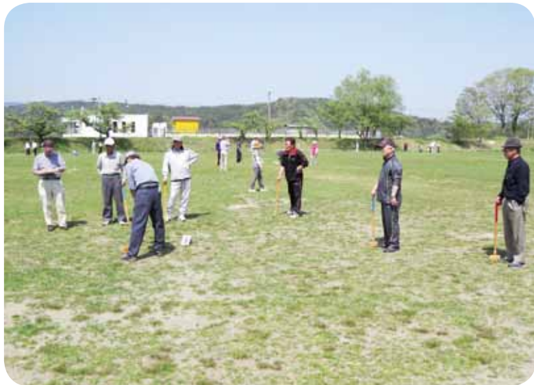
▲好スコア続出!! そうでない方も...

5月15日、石川町と姉妹都市である宮城県角田市の議会議員との親善交流会が行われました。 今年、石川町の母畑レークサイドセンターを会場に、グラウンドゴルフで交流しました。