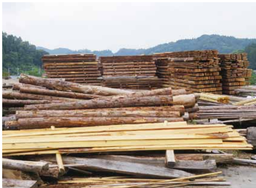
▲地元産木材の利用促進を

回答 森林の除染については、国による実証事業の結果、間伐による空間線量率の低減が確認されています。