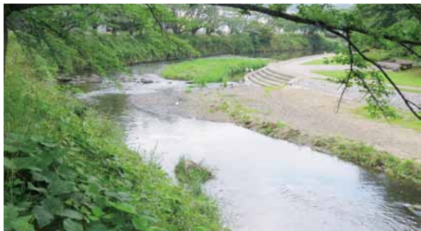
▲もっときれいな水質にならないか（今出川）