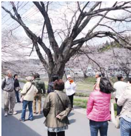
▲ボランティアガイドが桜をPR

質問 次年度は、宿泊客を増やすよう旅行会社と協議しコース設定できないか。 答弁 旅行会社と十分な打ち合わせをし、石川町に泊まることでメリットがあることを、来年度のプランに入れていただくよう協議します。 質問 さくらの里づくり愛護団体等への支援は。 答弁 「さくらの郷づくりプロジェクト」を推進するため、地区まちづくり交付金や国県の補助金などを活用し、様々な取り組みに対し支援していきたいと考えています。 要望 各地域で取り組むことで、すばらしい桜の町になると思っているので、支援体制の強化をお願いしたい。 質問 ボランティアガイドの育成は。 答弁 おもてなしの心をもった桜の案内は、観光客の方々に大変喜ばれました。桜に限らず町全体を紹介できるようなボランティアガイドの育成についても、今後検討していきます。