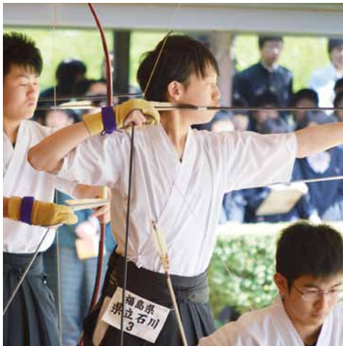
▲集中して的確をねらう(弓道大会より)

ありません。 学校の先生という仕事は、きっと私が思っている以上に大変だと思えます。簡単になれるものではないし、先程挙げたような問題を解決していくという課題もあります。 しかしそれは、これからの社会を担っていく私たちの果たすべき義務であり、公務員として社会に貢献することの意義であるとも思っています。