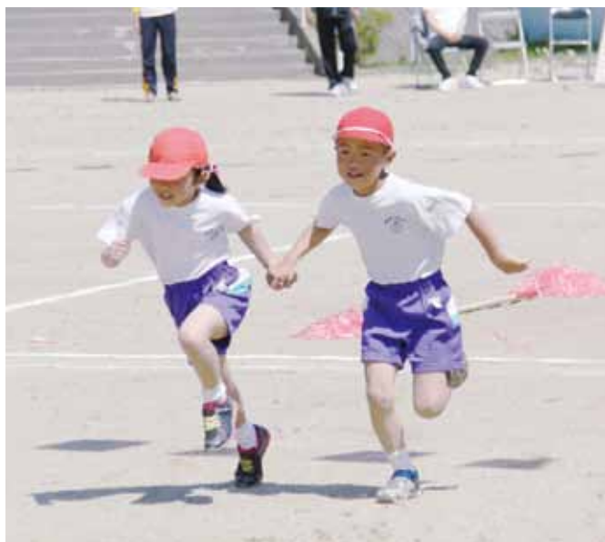
▲子どもたちの健やかな成長を（南山形小運動会）

答弁 いじめについては、本年度4月現在学校が認知した報告はありません。なお、昨年度は小学校8件、中学校で2件のいじめを認知しましたが、いずれも当事者や保護者を含めて対応し、全て解決済みとなっております。不登校は4月現在、小学校で3人、中学校で4人となっております。その状況に応じて家庭訪問を実施し、悩みや不安の聞き取りや登校への意欲づけ、保護者との話し合いと対応策の共有化を行っています。さらには、保健室を居場所とする登校など段階的な方法の対応も