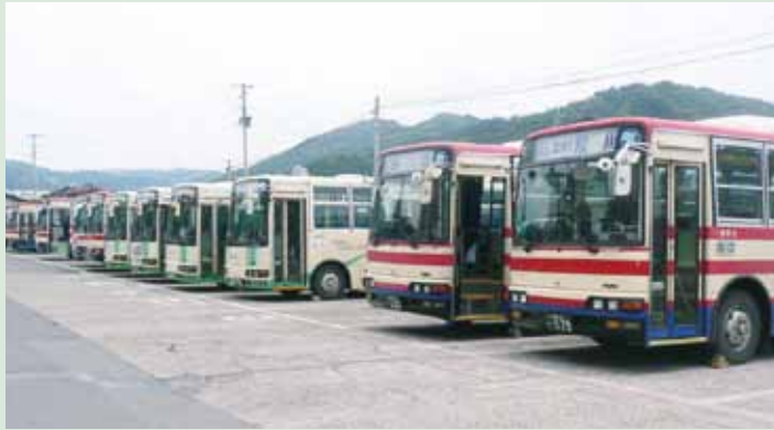
▲福島交通石川営業所バスターミナル