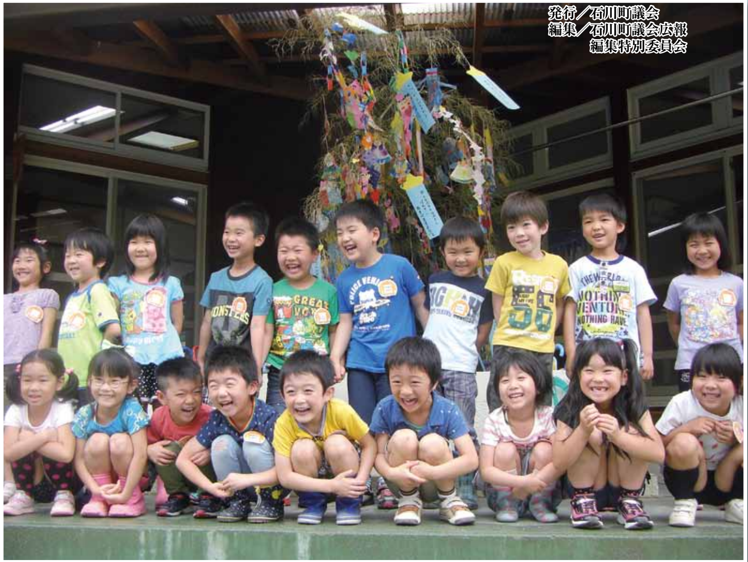
▲できたよ! たなばたかざり。(第2保育所年長組)