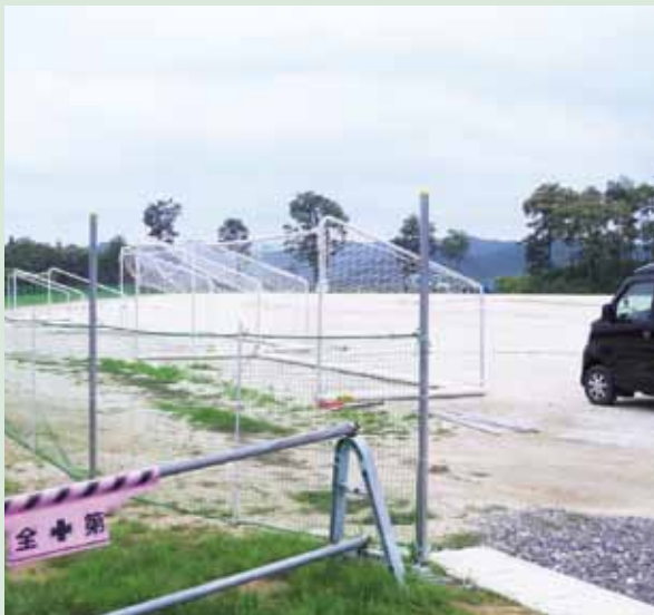
▲サブグラウンドの整備がすすむ総合運動公園