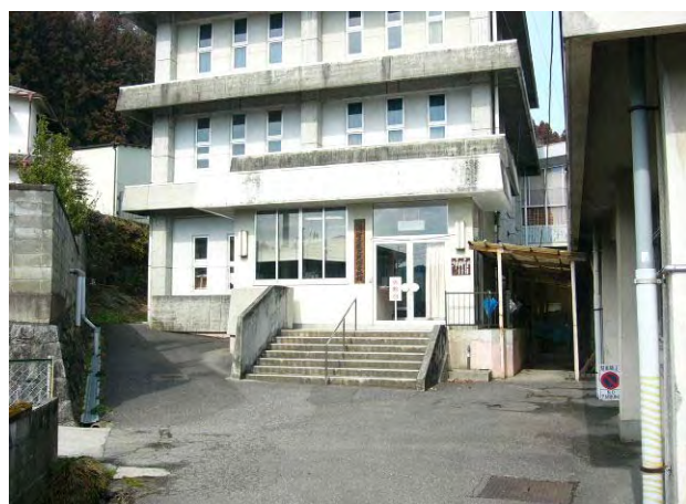
石川町の鉱物など多数展示