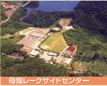
母畑レークサイドセンター