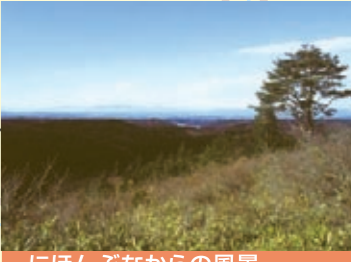
にほんぶなからの風景