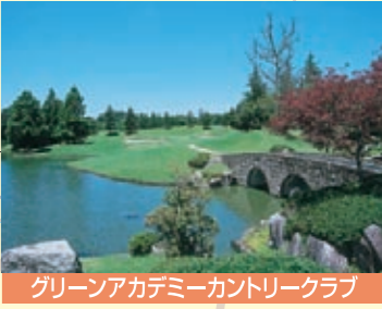
グリーンアカデミーカントリークラブ