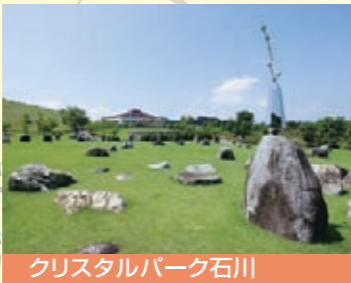
クリスタルパーク石川