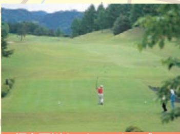
福島石川カントリークラブ